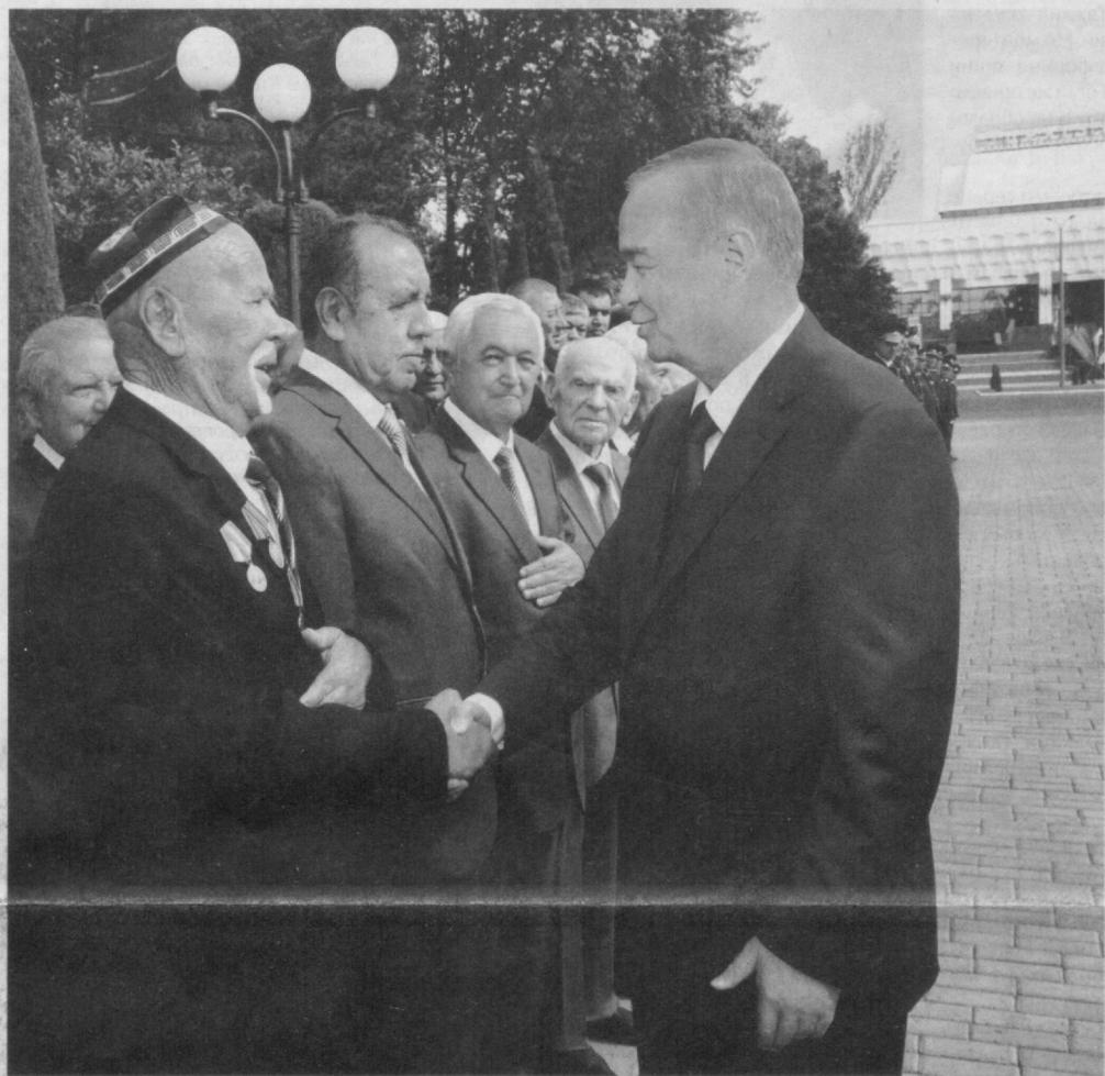
По инициативе Президента Ислама Каримова 9 Мая - День памяти и почестей широко отмечается в нашей стране как всенародный праздник

Почитание памяти предков, проявление особого уважения и внимания к представителям старшего поколения, внесшим достойный вклад в обеспечение мира и развития страны, являются для нас одними из национальных ценностей. День памяти и почестей, широко отмечаемый по инициативе главы нашего государства, также воплощает эти благородные принципы.