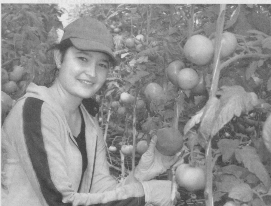
Общество с ограниченной ответственностью "Табиа немати" в Каганском районе при содействии Бухарского филиала "Узпромстройбанка" на площади в 2,53 гектара организовало теплицу.

В ней установили оборудование южнокорейской компании "Myung Sung Placon", выращивают