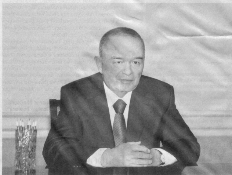
Президент Республики Узбекистан Ислам Каримов 24 мая в резиденции Оксарой принял министра иностранных дел Российской Федерации Сергея Лаврова.

На встрече обсуждены состояние и перспективы многопланового узбекско-российского взаимодействия, актуальные вопросы международной политики.