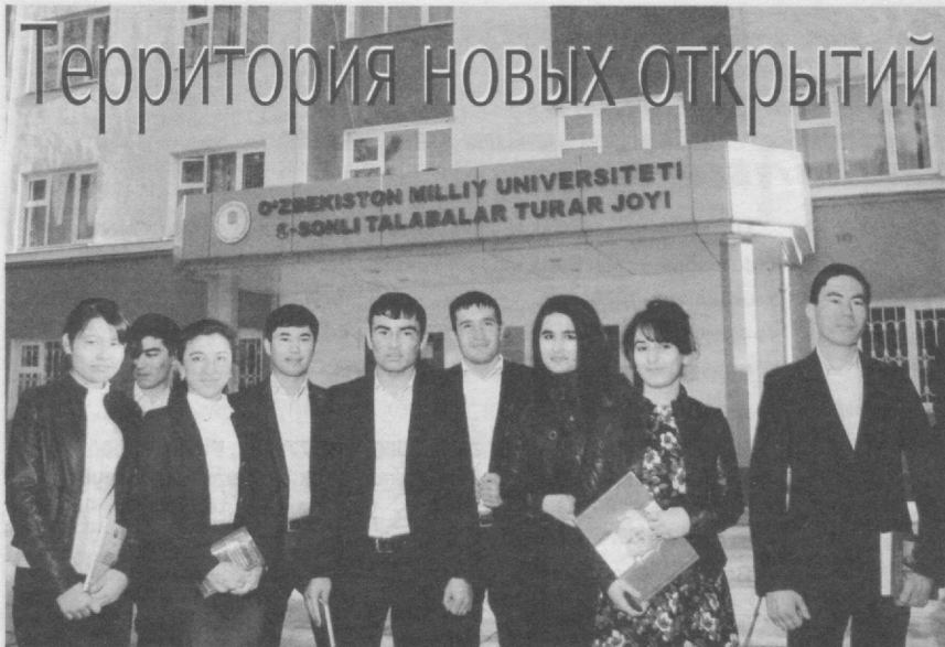
■ Есть в Ташкенте небольшой городок. Здесь следуют укрепляющимся с годами традициям - стремиться к знаниям, жить дружно, соблюдать чистоту на территории и относиться ко всему так, как если бы это место было вторым домом. По сути для юных жителей студенческого городка "Ёшлик" он таковым и является. Территория молодости и новых открытий - своего рода мини-модель самого Узбекистана, где каждый может найти простор для профессиональной и творческой самореализации.