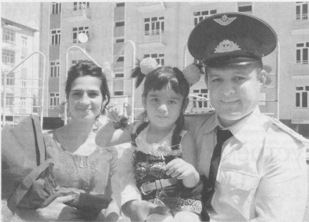
Семья военнослужащих Восточного военного округа вручены ключи от квартир в многоэтажном доме, возведенном в одном из военных городков Наманганской области.

На мероприятии с участием представителей Министерства обороны Республики Узбекистан, командования войск Восточного военного округа, хокимията области, областных отделений фондов "Махалла" и "Нуроний", общественного движения молодежи "Камолот" и работников средств массовой информации отмечалось, что результаты осуществляемых под руководством Президента нашей страны реформ в оборонной сфере находят свое воплощение в усилении социальной поддержки военнослужащих и их семей.