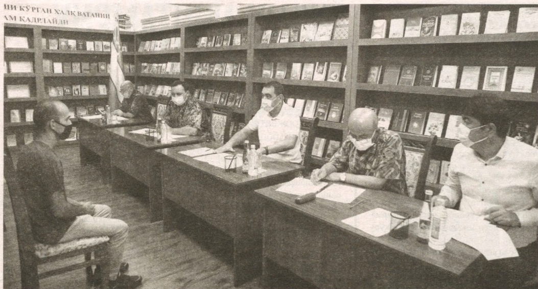
FARMON VA IJRO