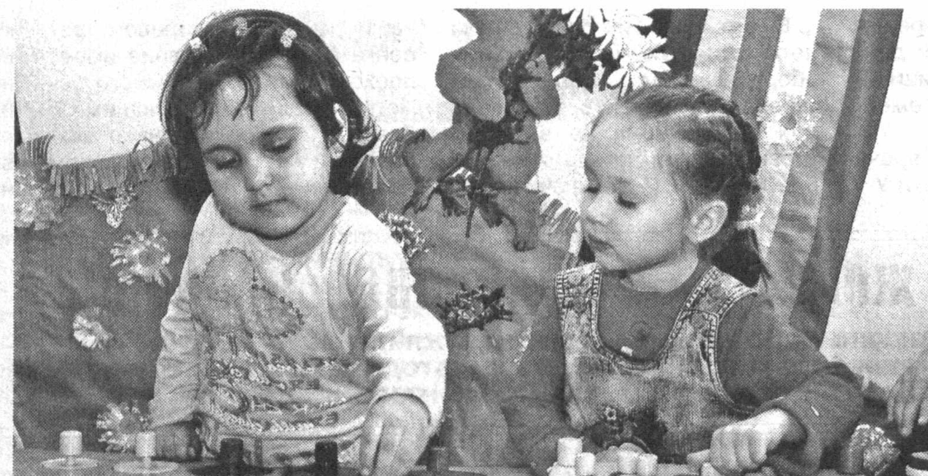
Занятия в детских образовательных учреждениях развивают творческие способности, фантазию и образное мышление детей.