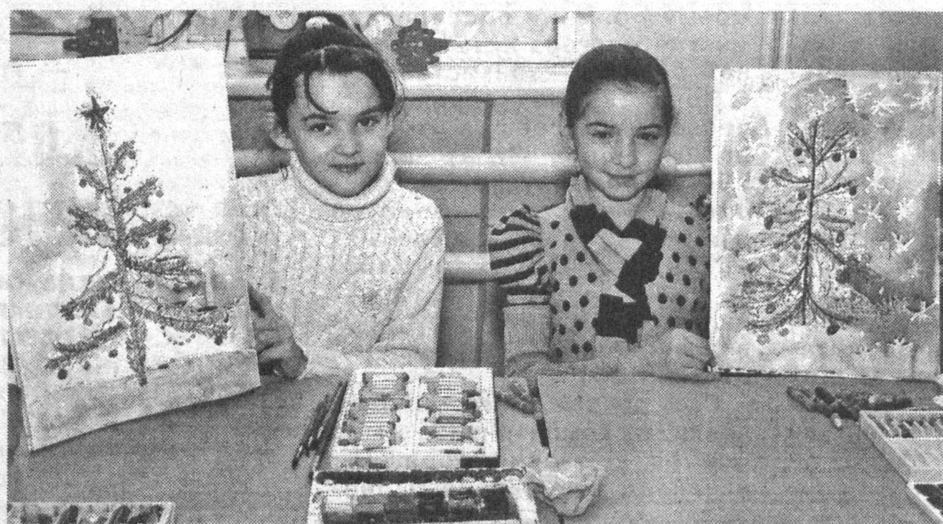
В Городском центре детского творчества юные таланты постигают азы изобразительного искусства.