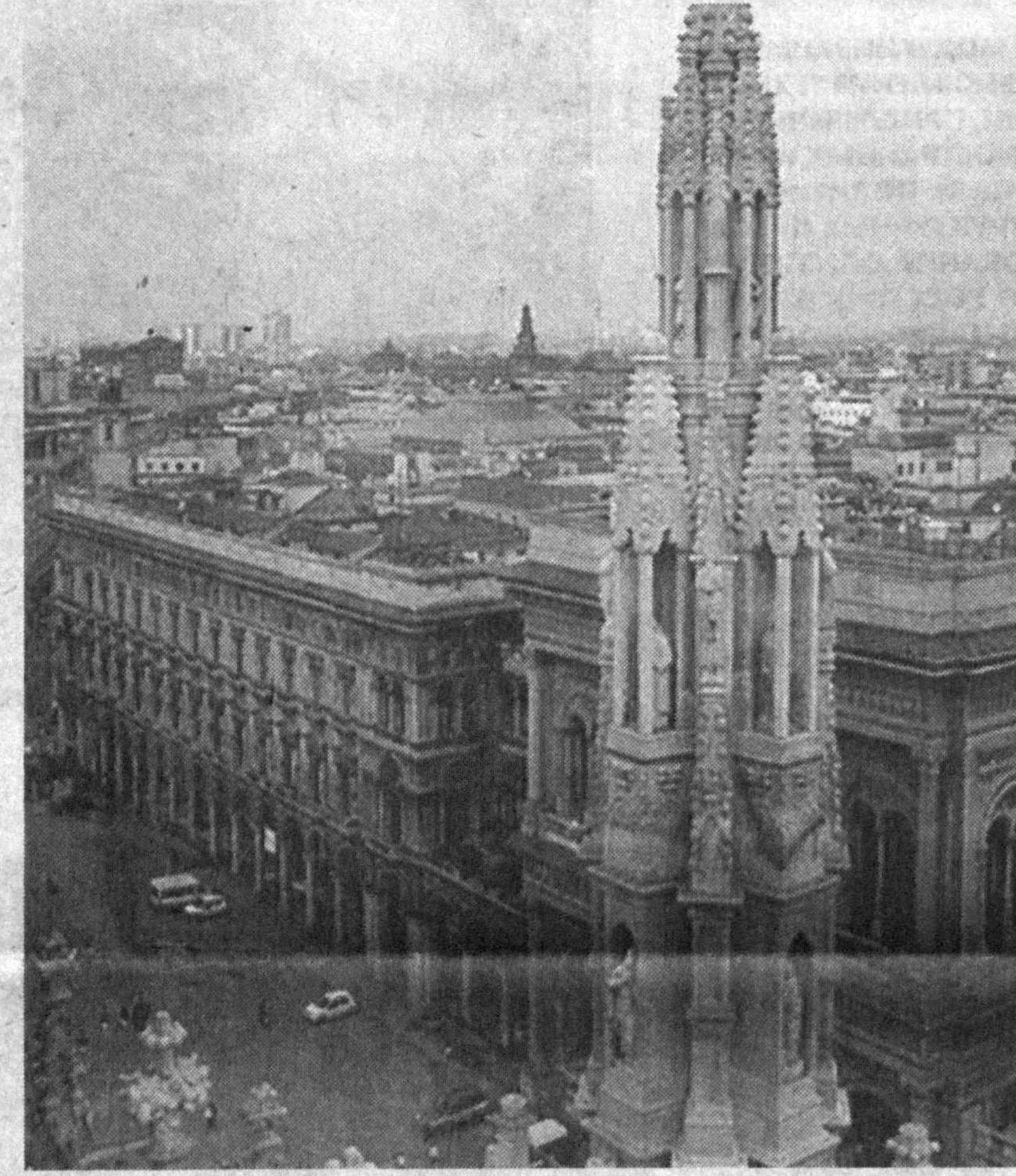
По городам мира. Италия.

Беседу вела Нургүль АБДУРАИМОВА, корр. УзА.