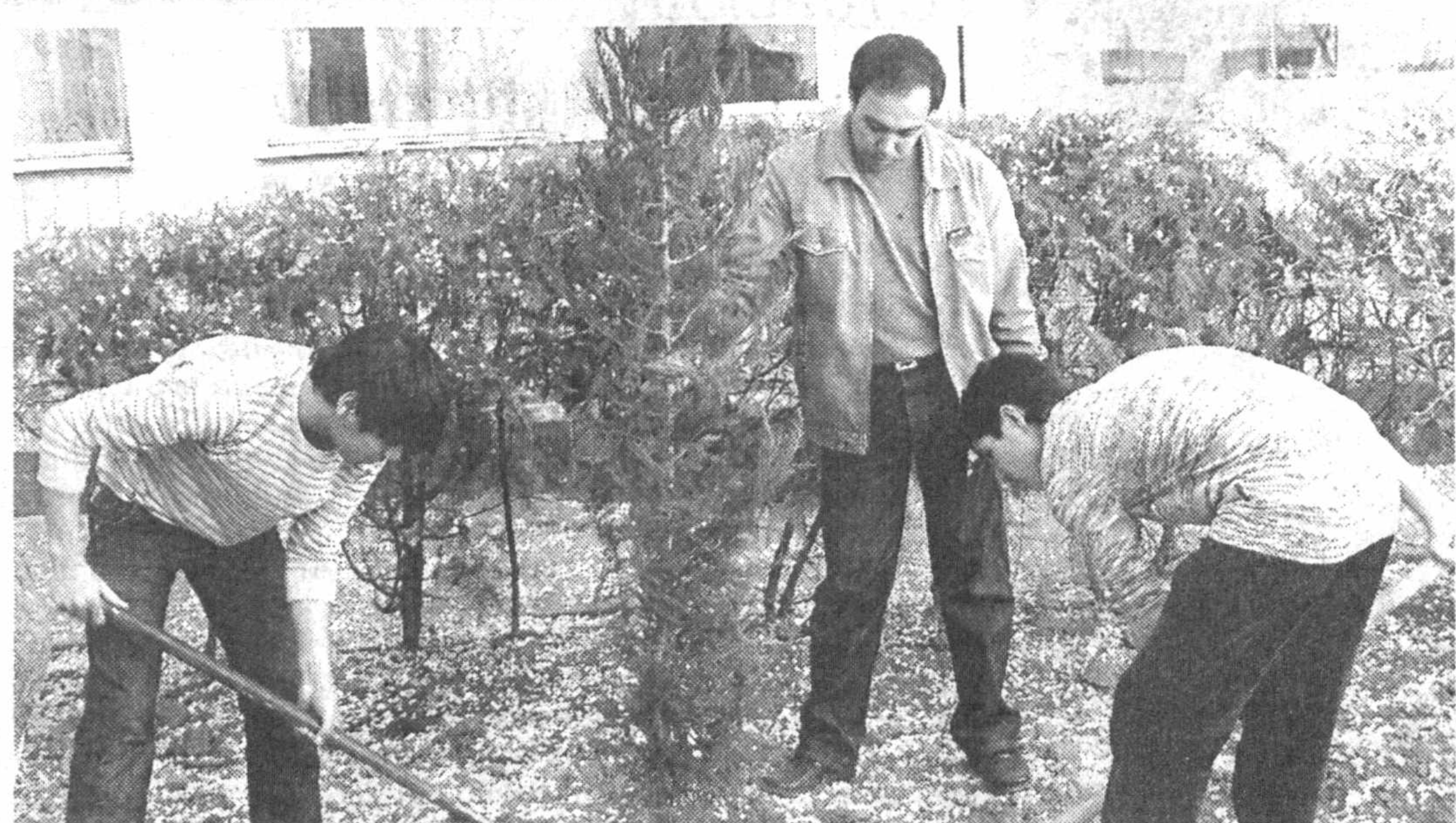
Городу – красоту и зеленый наряд