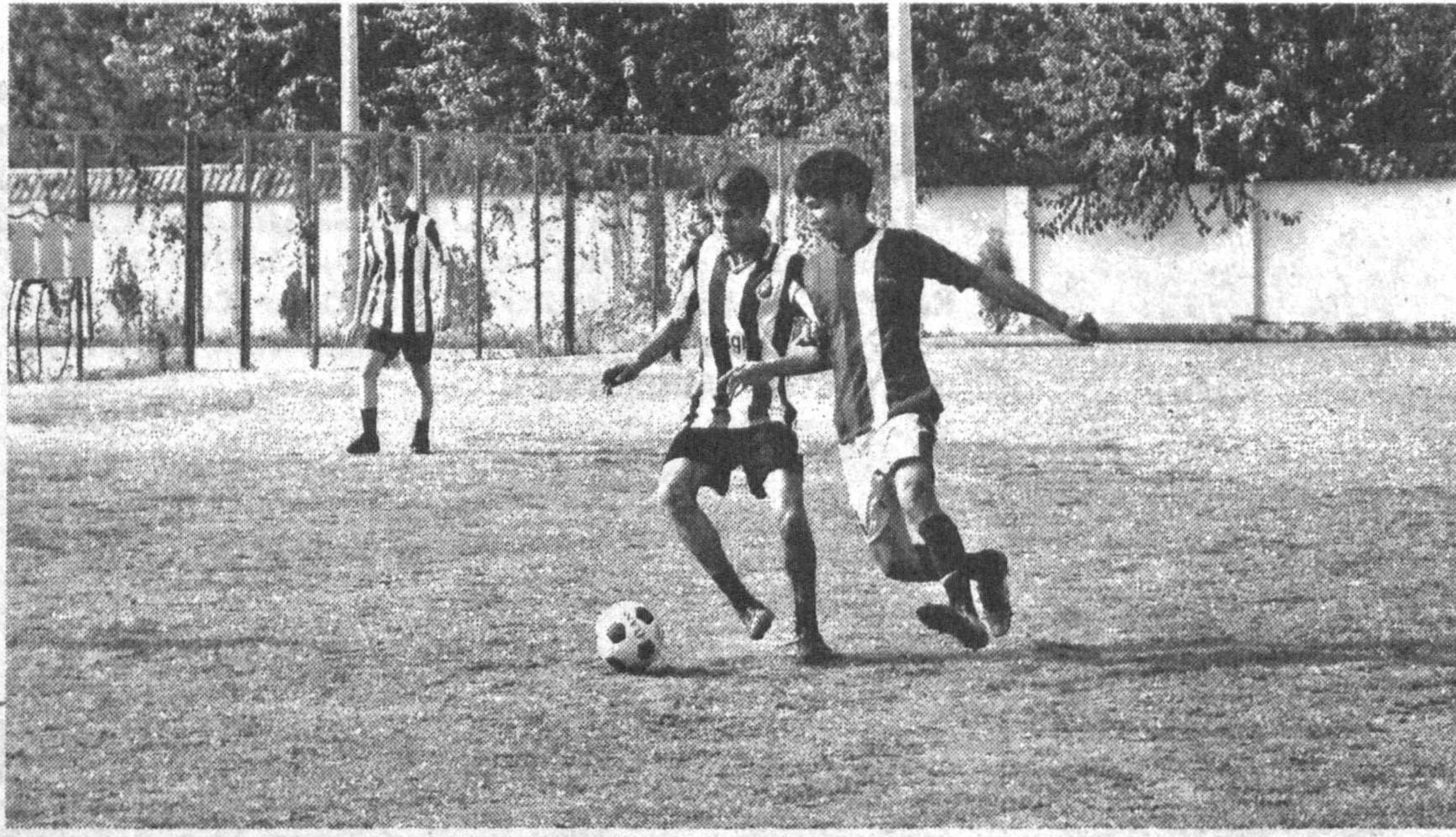
Растут будущие чемпионы.