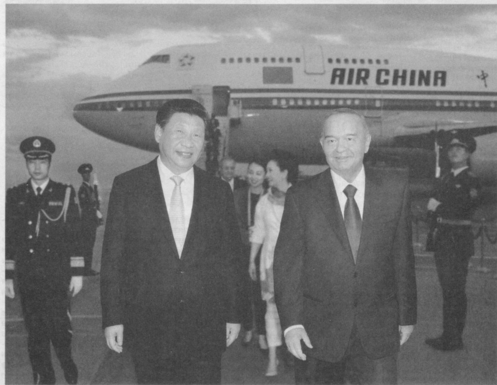
По приглашению Президента Республики Узбекистан Ислама Каримова 21 июня в нашу страну с государственным визитом прибыл Председатель Китайской Народной Республики Си Цзиньпин.

В Ташкентском международном аэропорту, украшенном государственными флагами двух стран, высокого гостя встретил Президент Республики Узбекистан Ислам Каримов. После краткой беседы делегация Китая направилась в отведенную для нее резиденцию в комплексе Куксарой.