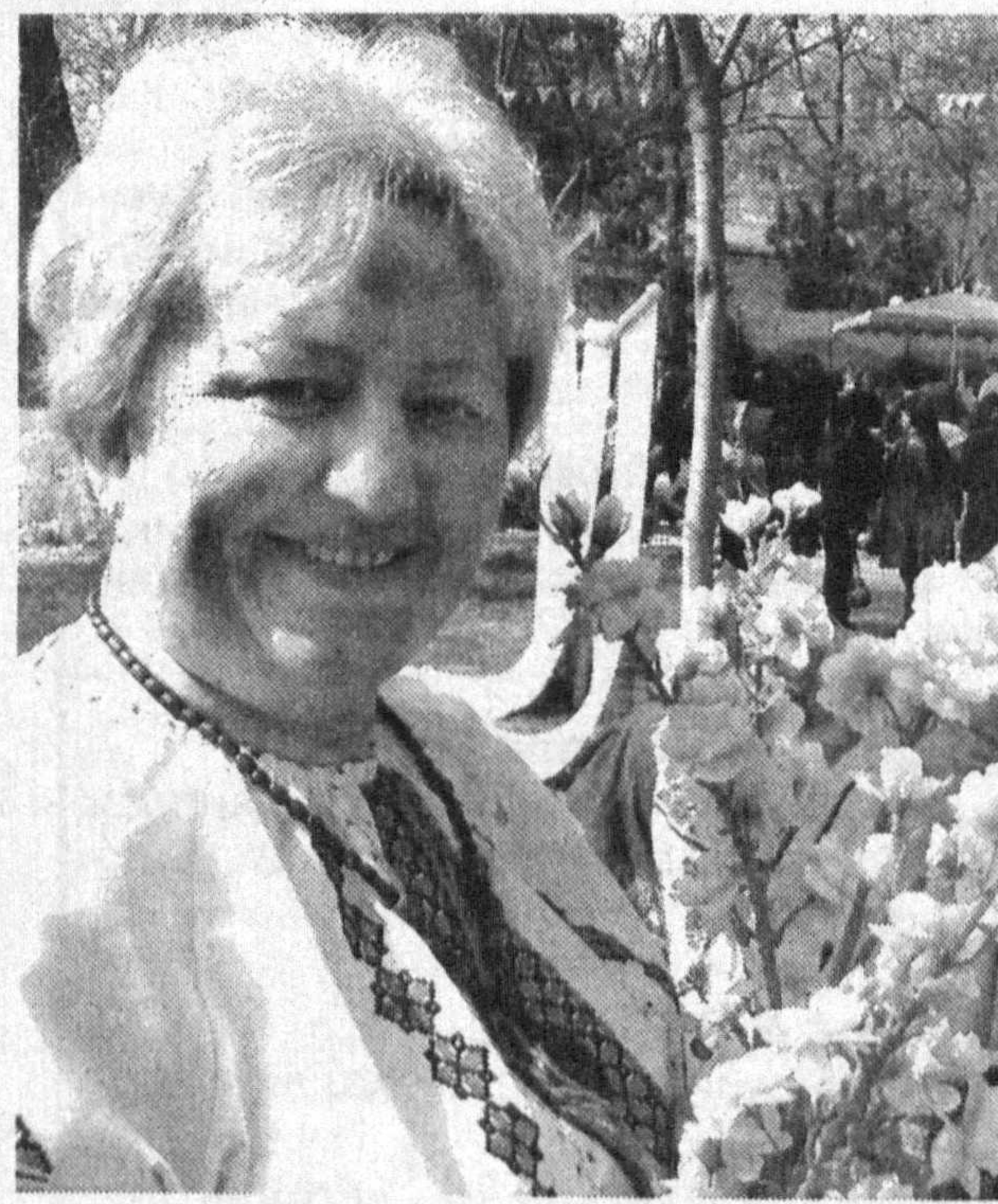
Весна – время обновления, радости, веселья.

Приподнятый дух мероприятия придали праздничные программы национальных культурных центров. В мероприятии приняла участие заместитель Премьер-министра Республики Узбекистан, председатель Комитета женщин республики Ф.Ақбарова.