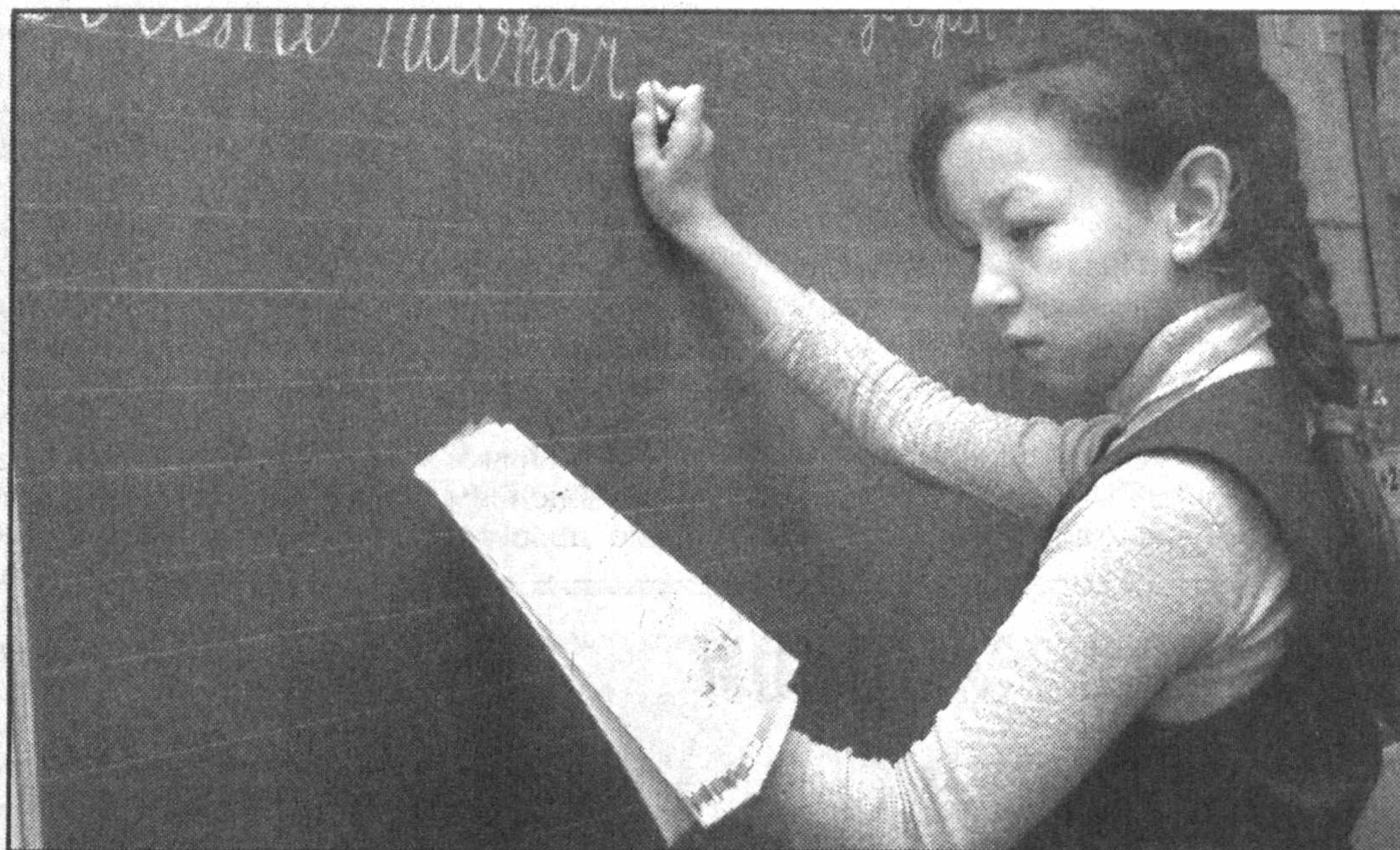
Вычитать и умножать, буквы красиво написать — учат в школе.