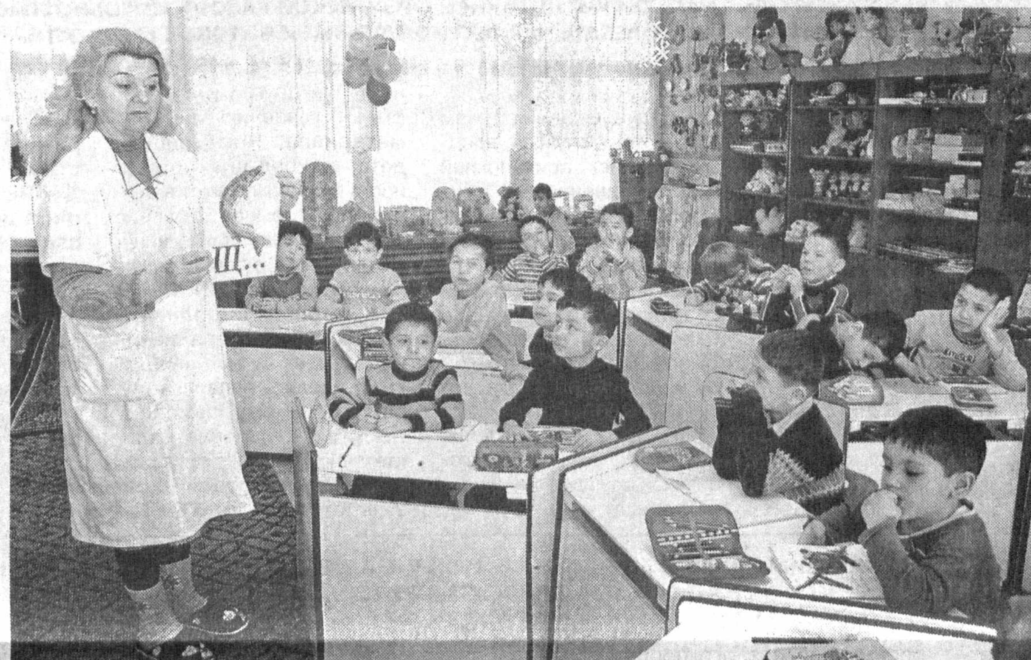
На староромное развитие малышей, их способностей в соответствии с современными требованиями направляют свои усилия воспитатели дошкольного образовательного учреждения № 398 Мирабадского района.