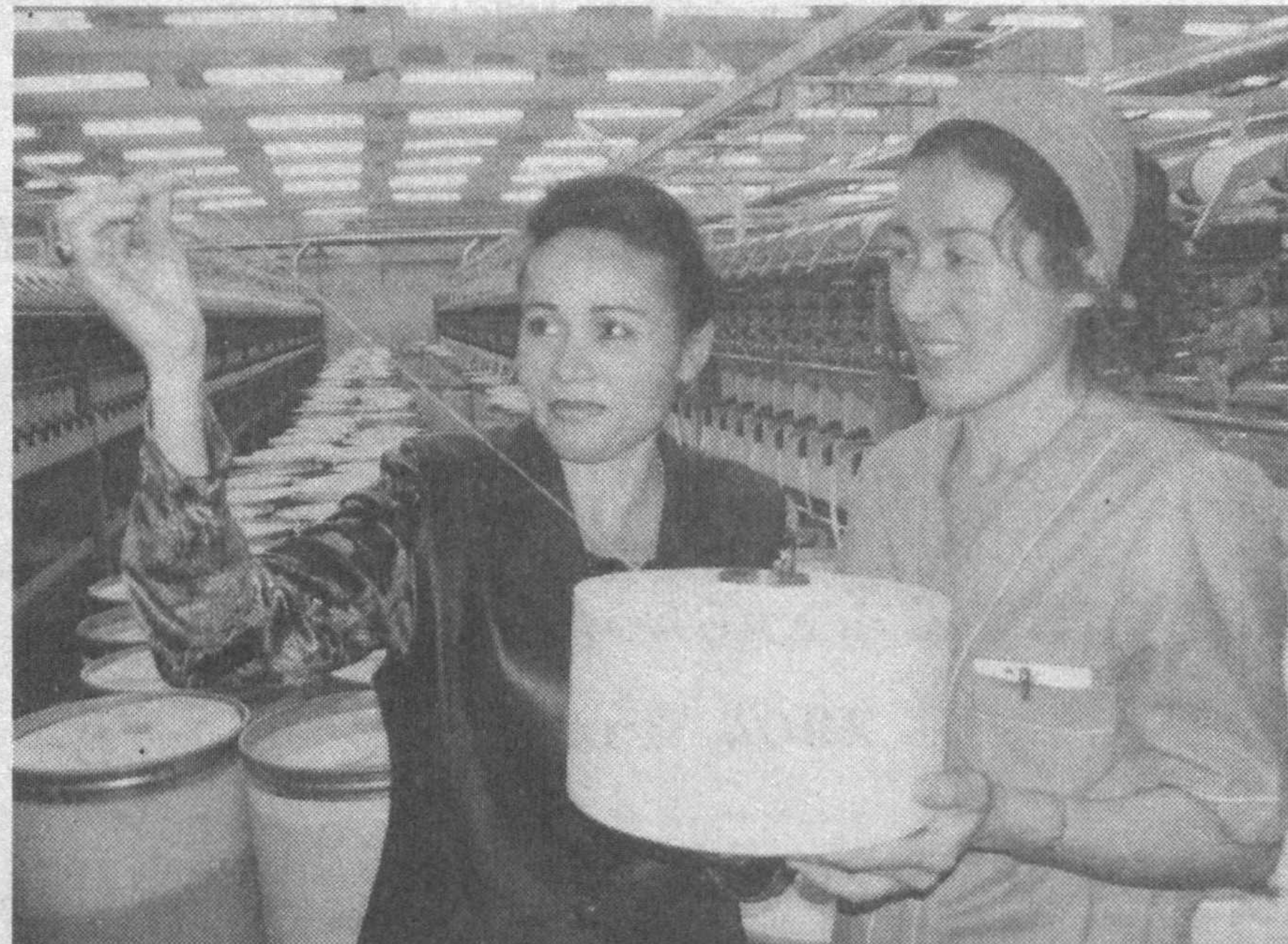
ми чет элга экспорт қилинмоқда. Суратларда: корхона фаолиятдан лавҳалар.