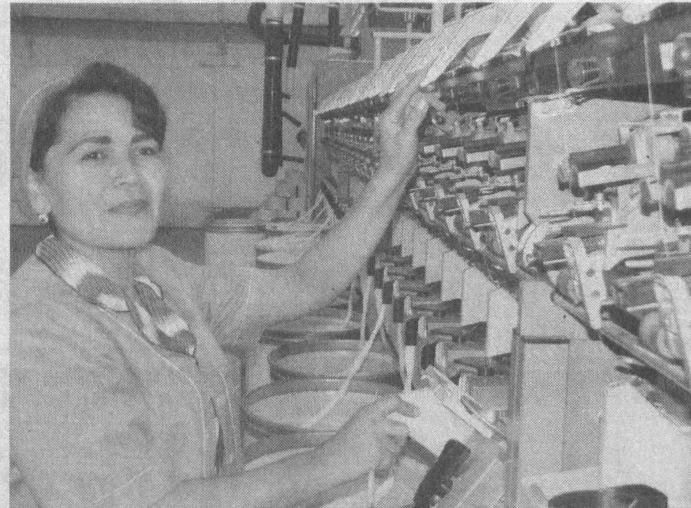
Ҳазорасп туманидаги «Унико» кўшма корхонаси фаолиятини бошлаганига кўп бўлгани йўқ. У бундан бир йил аввал Германиялик тadbиркорлар билан ҳамкорликда ташкил этилган эди. Шу қисқа вақт ичида бу