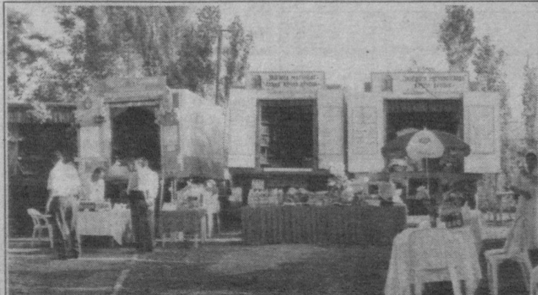
(Давоми. Боши 1-бетда).