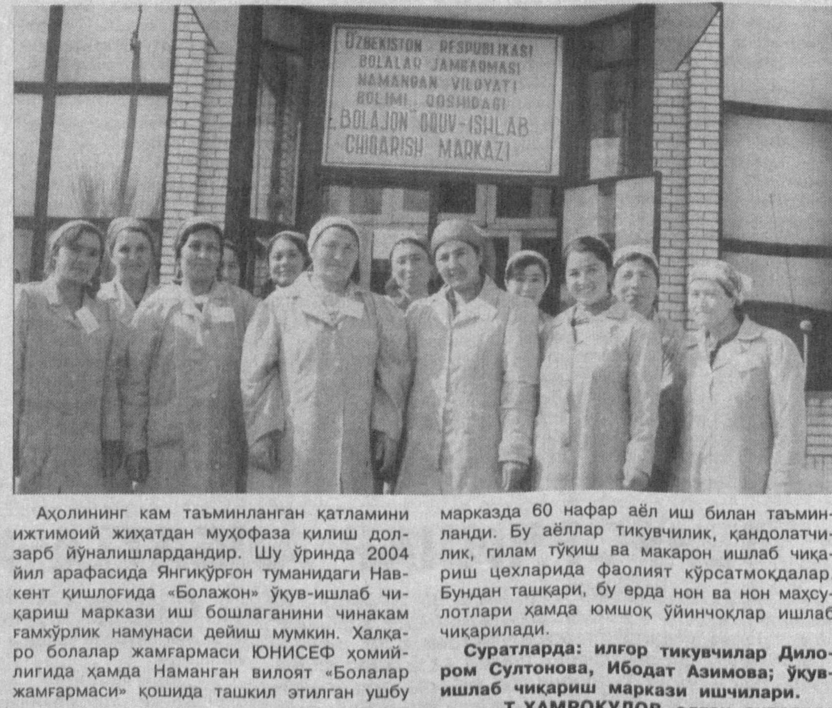
Аҳолининг кам таъминланган қатламни ижтимоий жиҳатдан қўллаб-қувватлаш мақсадида «Ишонч»нинг «Боложон» қўшма корхонаси ташкил қилинган. Шундан 2004 йил арасида Янгиқўрган туманидаги Навкент қишлоғида «Боложон» қўшма корхонаси ишга туширилди. Қўшма корхонада ишлаб чиқариш маркази иш бошлаганини чинакам ғамхўрлик намунаси дейиш мумкин. Халқаро болалар жамғармаси ЮНИСЕФ хомийлигида ҳамда Наманган вилоят «Болалар жамғармаси» қошида ташкил этилган ушбу