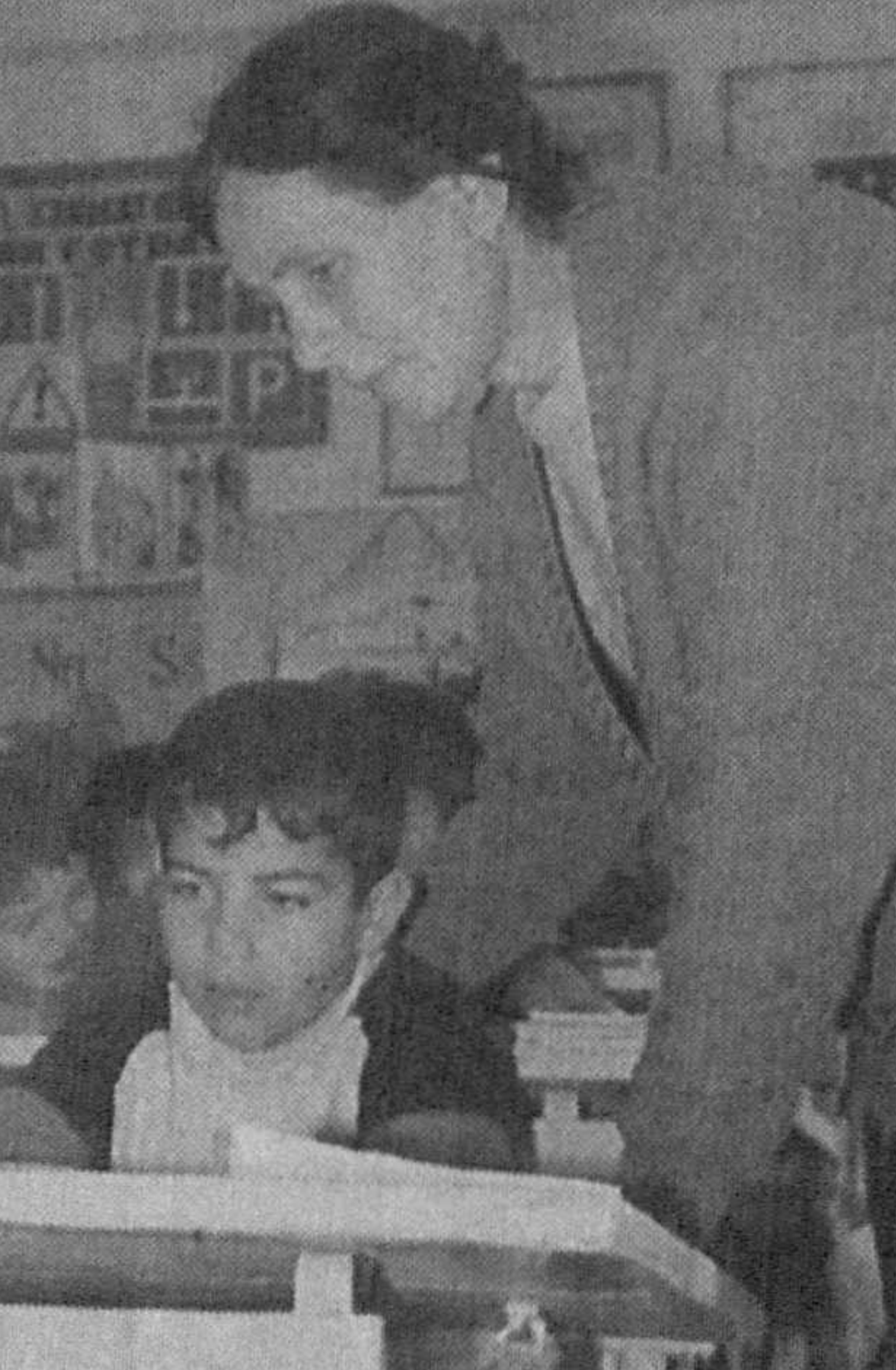
Олмалиқ шаҳридаги 5-ўрта умумтаълим мактабида айни чоғда 952 нафар ўқувчи таълим-тарбия оляпти...