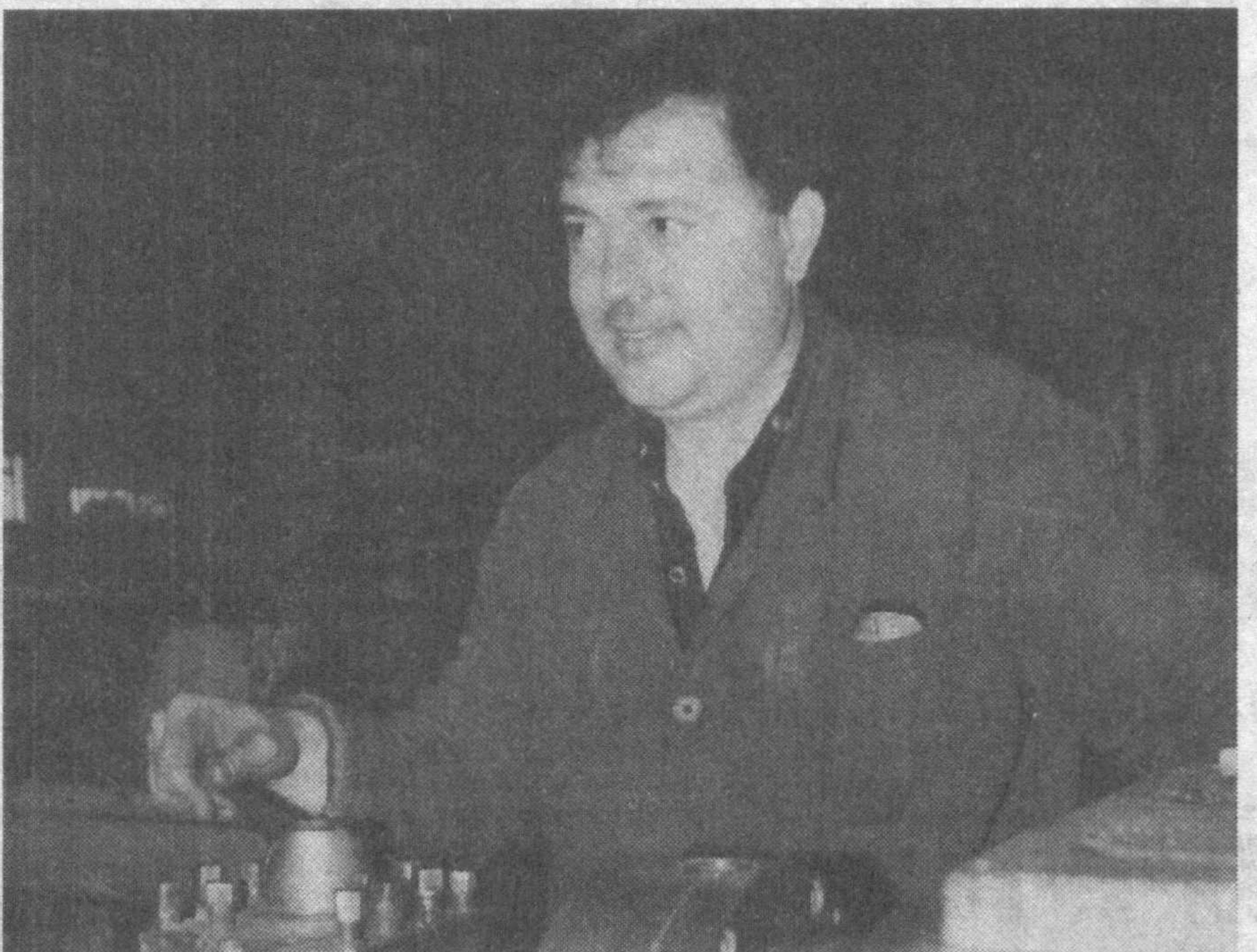
Пастдарғом туманидаги «Жума» ремонт механика заводи 1974 йилдан бери фаолият кўрсатиб келмоқда. Бу ерда 70 хилга яқин маҳсулот ишлаб чиқарилади. Корхонада 130 нафар ишчи меҳнат қилади. Ишчиларга барча кулайликлар яратилган. Бир сменада 8 тонна хомашў ишлаб чиқарилмоқда. Маъмур корхона Самарқанд вилоятининг 9 та пахта заводларини техник хизмат, той пахталарини симлар билан таъминлаб келмоқда.