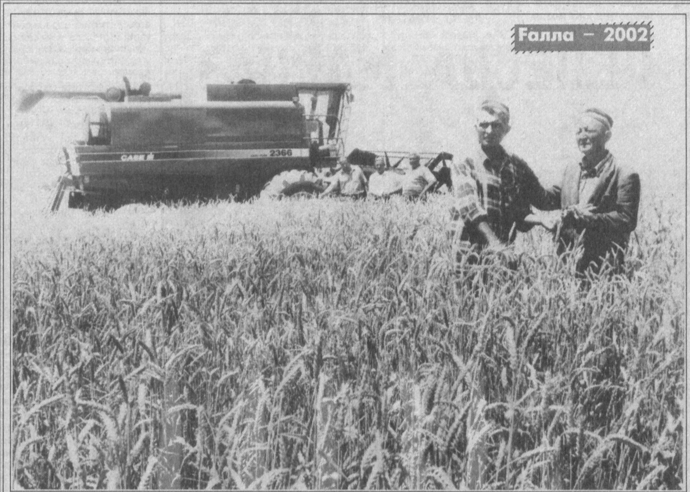
Галла - 2002