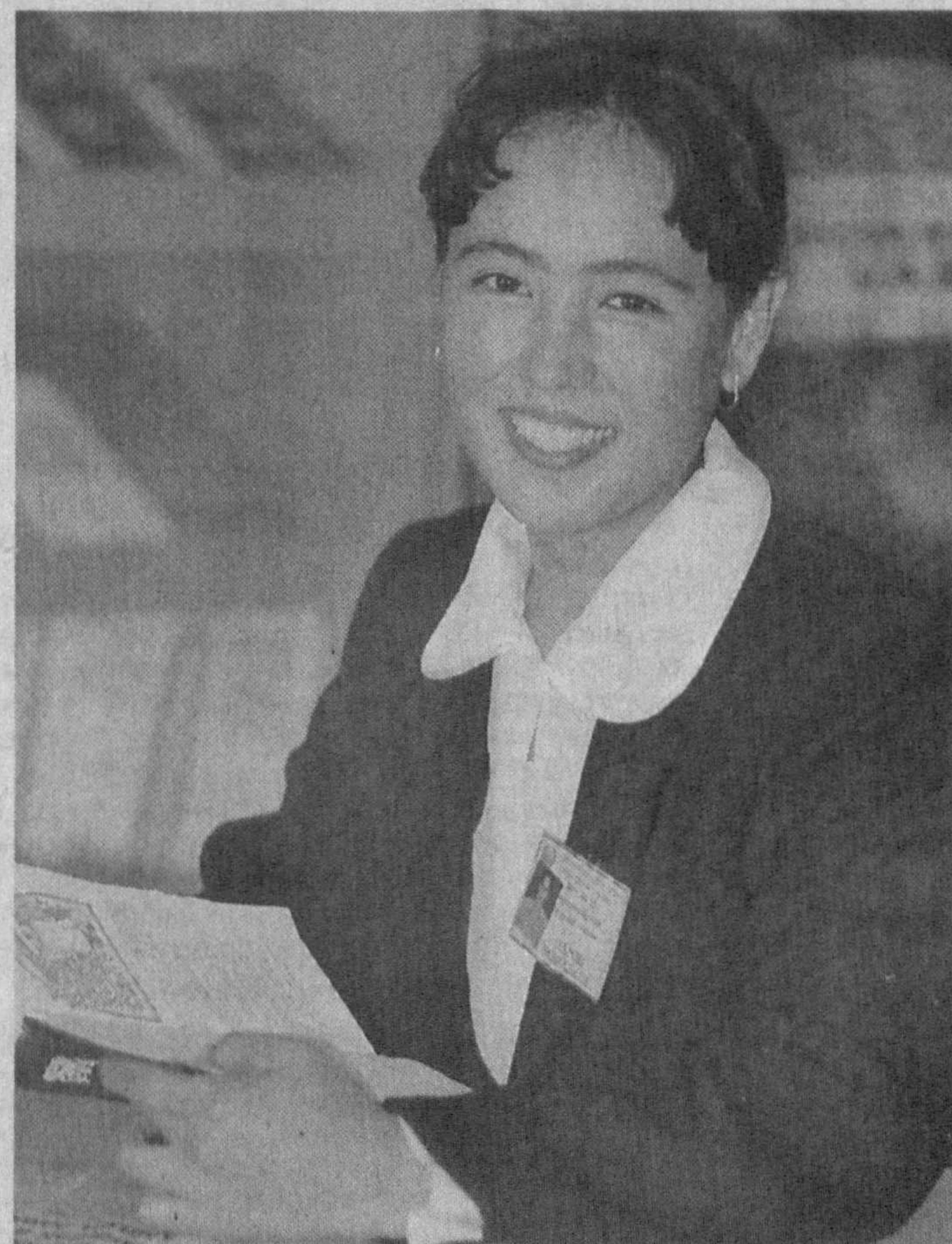
Евёвон автотранспорт касб-ҳунар коллежиди талабаларга ташкил қилинган бўлиб, ҳозирда 583 нафар талаба таҳсил олмақда.