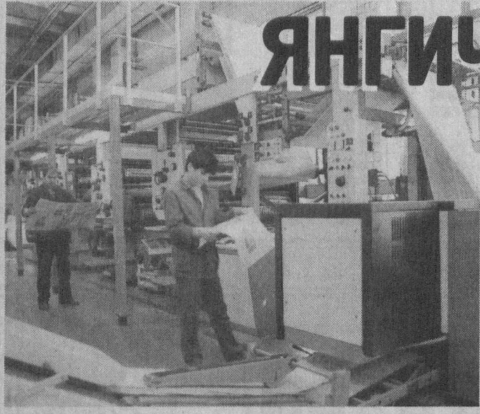
Бугун ҳар қадамда, замондошларимизнинг юриш-туришлари ва ҳатти-ҳаракатларида янгича бир экин намоён. У ижтимоий-сиёсий ва иқтисодий жараёнларда ҳам тобора аққол кўринмоқда. Инчунун, миллий матбуотимизда ҳам.

Булар мамлакатда хилма-хил йўналишлардаги 600 дан зиёд вақтли нашр чоп этилаётгани, телевидение ва радиостудиялар тармоғи, унинг катта-кичик шаҳарлар, илм ва ишлаб чиқариш жамоаларини ҳам қамраб бораётганлигида, матбуот тизимида янги, ёш, билимли ва ўтли-шудли ижодкорлар кўпая бошлаганида намоён бўлаётгани.