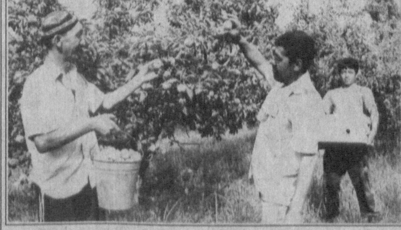
Ғалла, собзавот, мева, унум этиштиришга ихтисослашган «Байтқўрғон» Қибрай туманидаги кўп тармоқли ва энг йирик ҳўжалиқлардан бири. Бу ерда, айниқса, мевачиликка жиддий эътибор қаратилади. 209 гектар мевалик бонинг 130 гектари ҳосилга кирган, қолган 79 гектари янги барпо этилган. Боғлар 68 нафар онлавий пудратчиға бўлиб берилган.

ҳам қайта ишлаш қорхоналари жамоасига, ҳам шаҳар аҳолисига манзур бўлмоқда