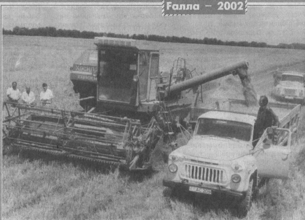
Галла - 2002

Ўзбекистон Республикаси Президенти И. КАРИМОВ. Тошкент шаҳри, 2002 йил 1 июль.