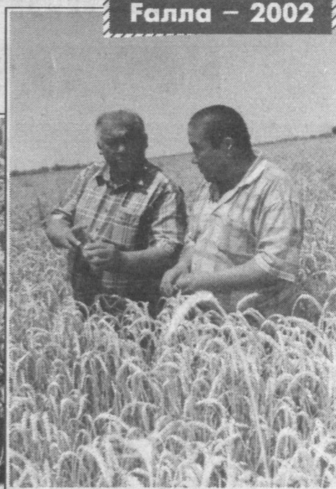
Галла — 2002