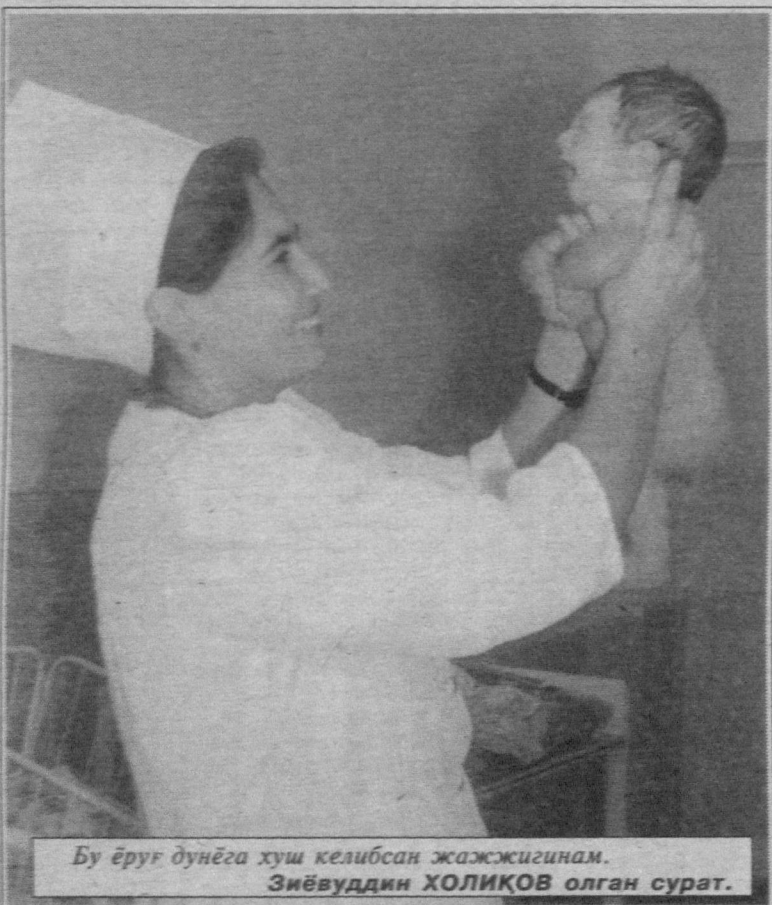
Бу ёруғ дунёга хуш келибсан жажжигинам.