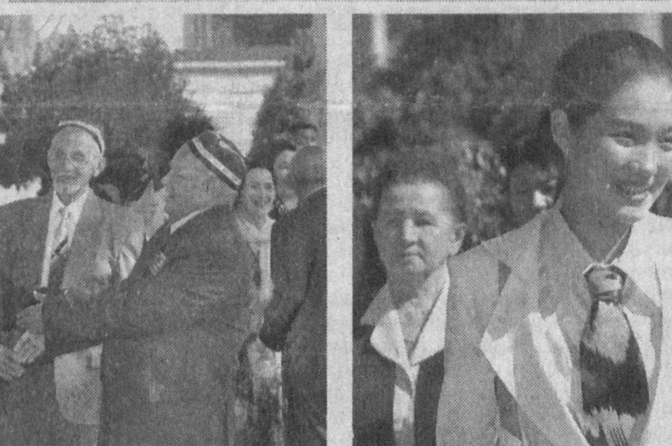
Олий Мажлиснинг ўн тўртинчи сессиясида сўзлаган нутқида батафсил фикр юритди.

Яқинда юртимизда содир этилган террорчилик ҳаракатлари тўғрисида гапирганда бир нарсга алоҳида эътибор бериш зарур. Адашганлар бор, уларни нотўғри йўлга бурган, ғаразли мақсад сари бошлаганлар бор. Аввало уларни бир-биридан фарқлаш лозим. Адашиб, ёт кучлар таъсирига тушиб қолган, қилмишидан астойдил пушаймон бўлган ёшларни, агар уларнинг ота-онаси, маҳалла-кўйи ўз кафилига олса, кечирамиз. Халқимиз бағрикенг, кечиримли, деди Президентимиз. Давлатимиз раҳбари шу