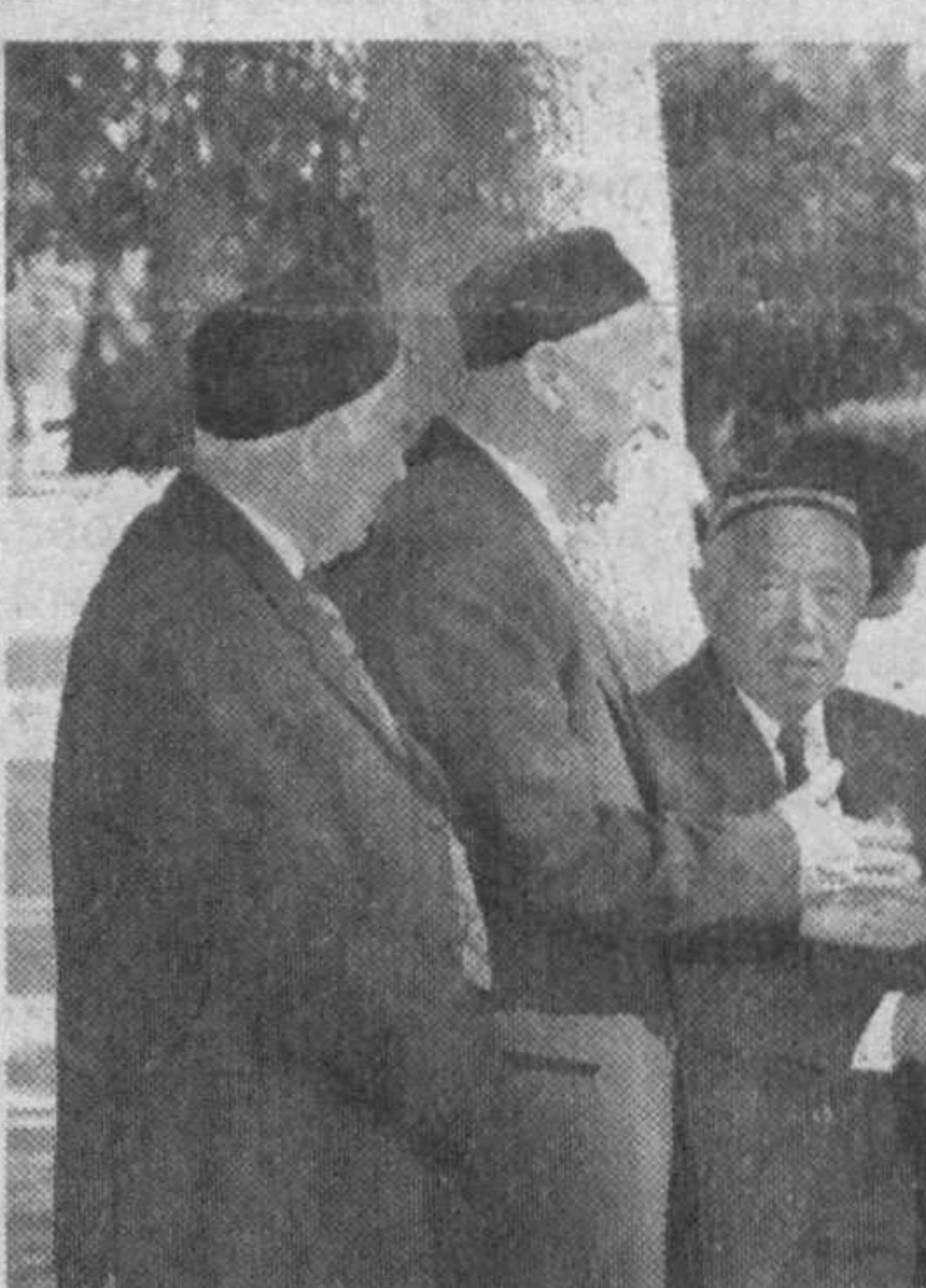
Ўзбек халқи ҳеч қачон бировга бош эгмаган, ҳеч кимдан кам бўлмаган ва ҳеч кимдан кам бўлмайди ҳам. Бунга тарихимиздан қўллаб-қувватлаш келтирилган шимиз мумкин. Бутун дунёга хавф солаётган терроризм халосига қарши курашда ҳам халқимиз жаҳон ҳамжамиятининг олдинги сафларида. Ҳозирги таҳликали замон, кечаги нафасимиздан ўтказган террорнинг қонли оқибатлари кишиларимиздан мудом оғохликни, ҳар қандай хавфга қарши бир тану бир жон бўлиб курашишни тақозо этмоқда. Биз ўз қадримизни ўзимиз биламиз - кучимиз ва қудратимиз ҳам шунда.

420 минг киши урушдан қайтмаган, 640 минг нафар ватандошимиз жараҳат олган. Таассуфки, Иккинчи жаҳон урушида иштирок этган юртдошларимиз сафи йилдан-йилга сийрақлашмоқда. Утган бир йил мобайнида беш ярим минг нафар уруш қатнашчиси вафот этди. Айни пайтда мамлакатимизда уларнинг сони қирқ минг нафардан ортмайди. Шундай экан, бу дунёда нафақат кексаларимизни, балки бир-биримизни авайлаб-ардоқлаб, қадримизга етиб яшашимиз лозим.