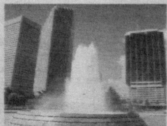
(ЖАҲОН ОММАВИЙ АХБОРОТ ВОСИТАЛАРИ ХАБАРЛАРИ АСОСИДА ТАЙЁРЛАНДИ).

Рим мэрияси бойишнинг бу ғаройиб усулини эътибордан четда қолдирмади. Қашшоққа бир неча бор жарима солишмоқчи бўлди, лекин нафи тегмади. Икки метрли норғул бу эркак ҳар гал ногиронлик гувоҳномасини пеш қилганча, ўзини ризидан маҳрум қилмоқчи эканларидан норози бўлиб, аюҳаннос солади, хатто ёлғондан кўз ёши тўқади. Охири уни судга беришди. Бу ерда ҳам масала очиклигича қолди. Судга берилганда эса, у Треви фавворасига ташланган танга-чақалар ҳеч кимнинг мулки эмаслигини қайд қилиб, ҳар бир киши уларни йиғиб олишга ҳақли эканлиги ҳақида ажрим чикарди. Чечеллетта иккита бадқовоқ ёрдамчилари билан фавворага ҳеч қандай шерик-перик бўладиганларни яқинлаштирмапти.