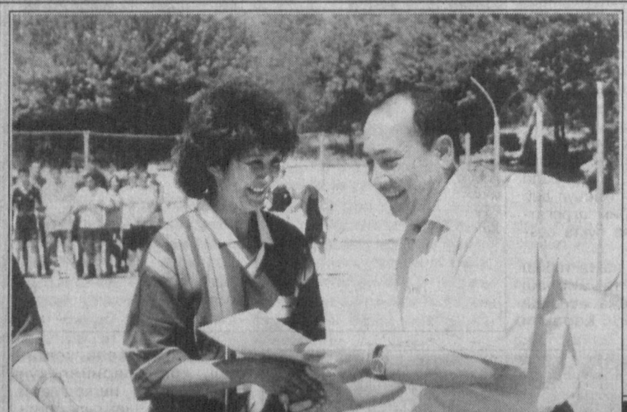
Уни Республика «Кўмир» ҳиссодорлик бирлашмаси ҳамда Ўзбекистон ёқилғи-энергетика, геология ва кимё саноати ходимлари касаба уюшмаси марказий кўмитаси ҳамкорликда уюштирди.

Тайёрлаш усуллари: 1. 3-5 дона олмани пўстини артмасдан тўғралди-да, 1 литр сув солинган ёпиқ идишда 10-15 минут қайнатилади. Сўнгра 3-4 соат дамба қўйиб, сувини иссиқ ҳолда чой ўрнига қунига бир неча марта ичилади. 2. Олма-ни майда тишли кирғичда қириб, баданининг куйган, совуқ олган ва яллиғланиб турган жойларига малҳам қилиб қўйилади.