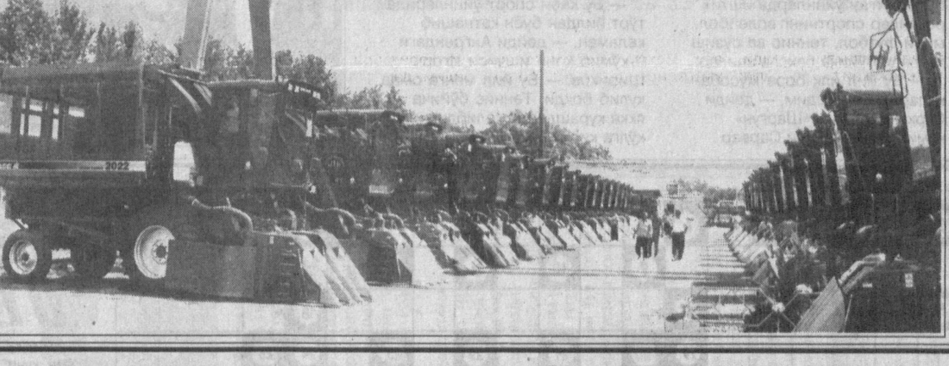
Эркебой БОТИРОВ олган суратлар.