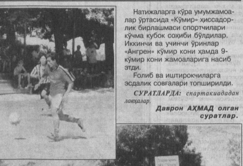
Натижаларга кўра умумжамоалар ўртасида «Кўмир» ҳиссодорлик бирлашмаси спортчилари кўчма кубок соҳиби бўлдилар. Иккинчи ва учинчи ўринлар «Ангрн» кўмир кони ҳамда 9-кўмир кони жамоаларига насиб этди.

Ангрнда Ўзбекистон кўнчиларининг мустақиллигимизнинг 11 йиллигига бағишланган тўртинчи Республика спартакиадаси бўлиб ўтди.