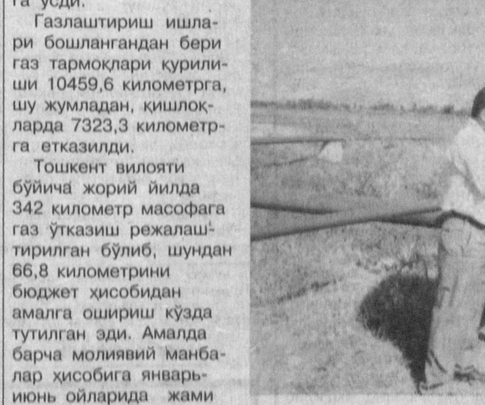
Газлаштириш ишлари бошлангандан бери газ тармоқлари қурилиши 10459,6 километрга, шу жумладан, қишлоқларда 7323,3 километрга етказилди.

С. УСЕНОВ, «Тошвилоятга таъминот» шўъба корхонаси директори ўринбосари.