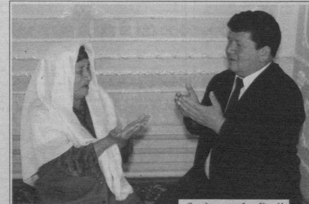
Она дуоиси ижобат бўлмай!

Ойга эргашгани офтоб кутади, Гуноҳдан қўрқгани савоб кутади. Бу дунё бир тутам, кафтингга қара, Искандар қўллари жавоб кутади.