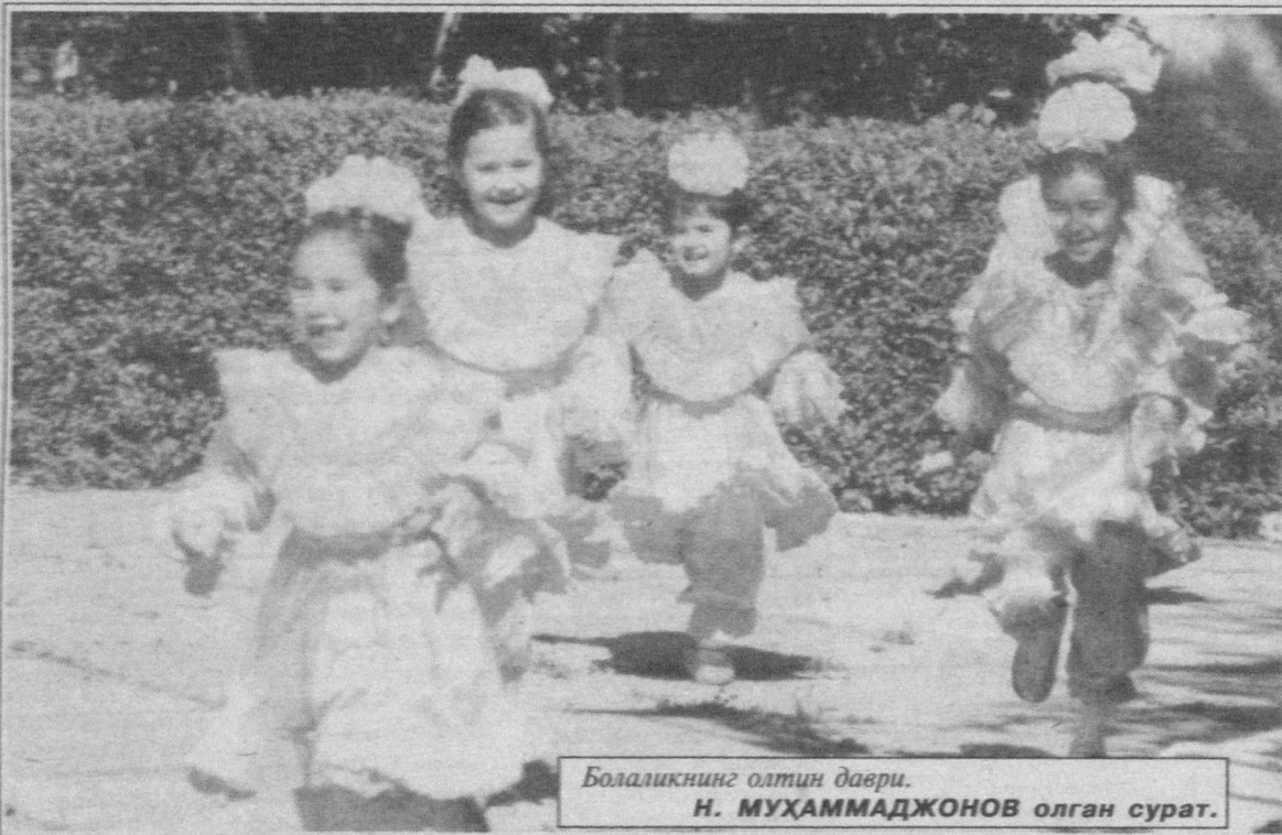
Болаликнинг олтин даври.