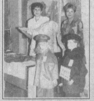
СУРАТЛАРДА: Олмалиқда ўстаган савдо ярмаркасининг суратлари.

Олмалик савдо ярмаркасининг яна бир ўзига хос хусусиятини алоҳида таъкидлаб ўтиш жоиз. Ташкил этилган кўргазмалар залининг бевосита ўзидо солиқ, божхона идоралари ва ҳокимият вакиллари учун столлар ўрнатилганлиги сабабли ўстаган тадбиркор товарлар экспорти ва импорти бўйича ҳужжатларни тўри расмийлаштириш юзасидан шу ёрнинг ўзидо кеш-