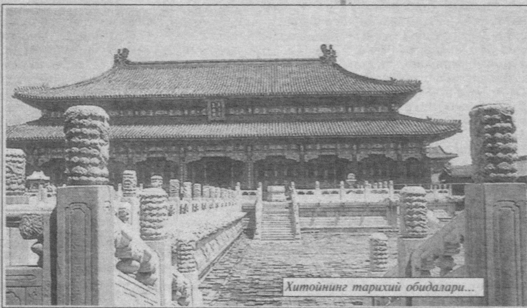
Хитойнинг тарихий обидалари...

Мутахассисларнинг таъкидлашича, ҳозирги демографик жараён янги муаммони келтириб чиқармоқда. Туғилиш камайган сари кексалар сони кўпайиб бораёпти. Мисол учун, ҳозир нафақат ривожланган, балки ҳамма мамлакатларда саксон ёшдан ошганлар тобора кўпаймоқда. Бу ҳол Хиндистон, Хитой, Нигерия, Бангладеш, Индонезияда яққол кузатиляпти.