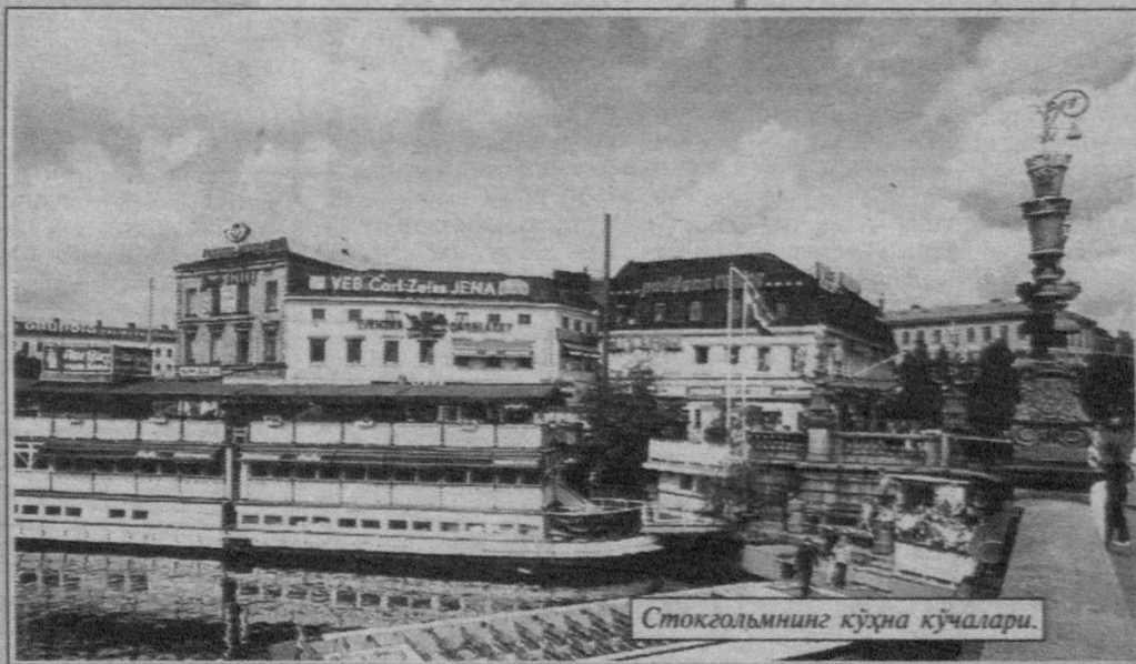
Стокгольмнинг кўча кўчалари.

Кейинги пайтларда Непалда вазият анча кескинлашди. Ҳукумат кўшинлари мамлакатда ноқонуний фаолият кўрсатаётган маочи исёнчиларни тугатиш бўйича йирик ҳарбий операцияларни амалга оширмоқда. Непал мудофаа вазирлигидан маълум қилинишича, яқинда ана шундай жангларда исёнчилардан 126 нафари йўқ қилинган. Ноябрь ойида Непалда парламент сайловлари бўлиб ўтади. Мамлакатда фавқулодда ҳолатнинг бекор қилиниши ҳам ушбу сиёсий тадбир билан боғлиқ. Ҳозир мамлакат аҳли ана шу тадбирга катта тайёргарлик кўрмоқда. Маочиларнинг нияти эса ҳар қандай йўл билан бўлсада, сайловга ҳалал бериш. Бошда исёнчилар ҳукуматга ўт очишни тўхтатиш ҳақидаги таклифни илгари сурганди. Бироқ ҳукумат бу таклифга рад жавобини берди. Чунки маочилар шу йўл билан вақтдан утиб, куч тўплаб олиши мумкин.