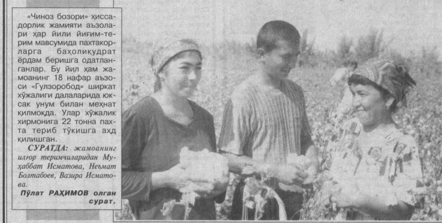
«Чиноз бозори» ҳиссдорлик жамияти аъзолари ҳар йили йиғим-терим мавсумида пахтакорларга баҳоликудрат ёрдам беришга одатланганлар. Бу йил ҳам жамоанинг 18 нафар аъзоси «Гулзоробод» ширкат хўжалиги далаларида юксак унум билан меҳнат қилмоқда. Улар хўжалик хирмонида 22 тонна пахта териб тўкишга аҳд қилишган.