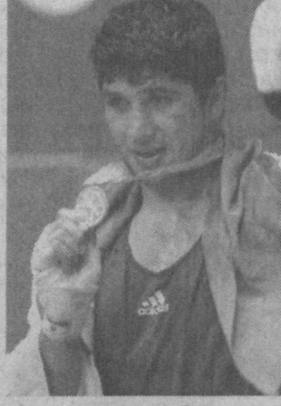
Осиё ўйинларида учинчи марта қатнашган ўзбекистонликлар 15 олтин, 12 кумуш ва 24 бронза - жами 51 медалга эришди.