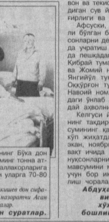
«Тошкенттўр» очик турдаги акциядорлик жамиятининг Бўқа дон маҳсулотлари қабул қилиш шохобчаси жорий йилда 32 минг тонна атрофида ғалла қабул қилди. Унинг жамоаси вилоятимиз ғаллакорларига экиш учун катта ҳажмда сара уруғ тайёрлади. Хар кўни уларга 70-80 тонна шундай маҳсулот етказиб турилди.