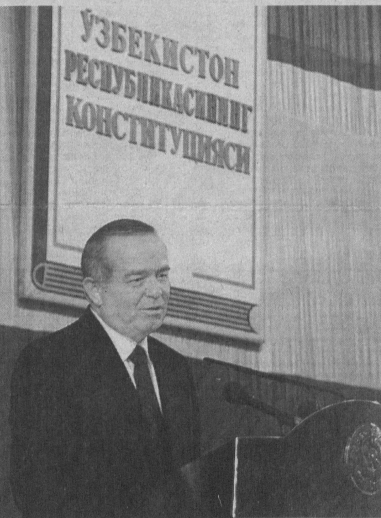
лат қуришга интилаётган эканмиз, бундай ҳолатлардан ўз ўғирмасдан, қочмасдан, ак- синча, бунга олиб келувчи сабабларнинг таг-