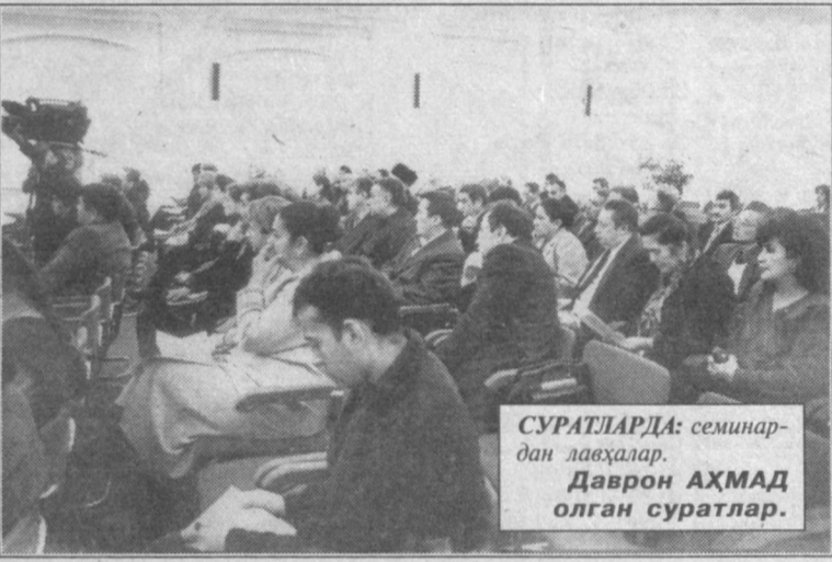
СУРАТЛАРДА: семинардан лавҳалар.