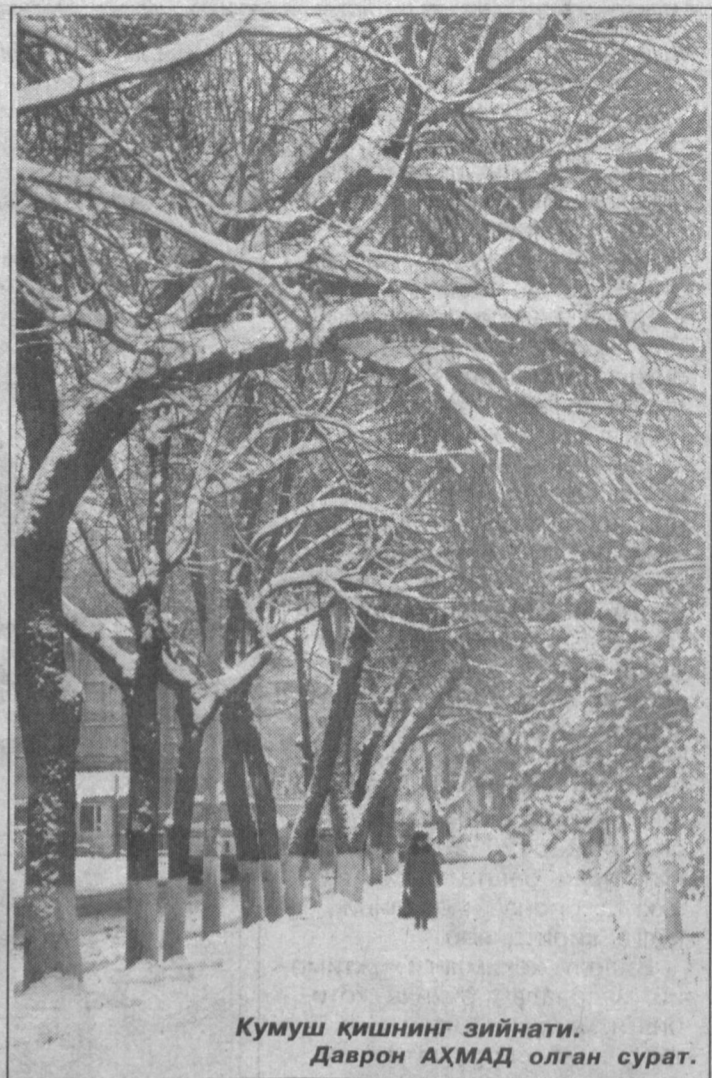
Кумуш қишнинг зийнати.