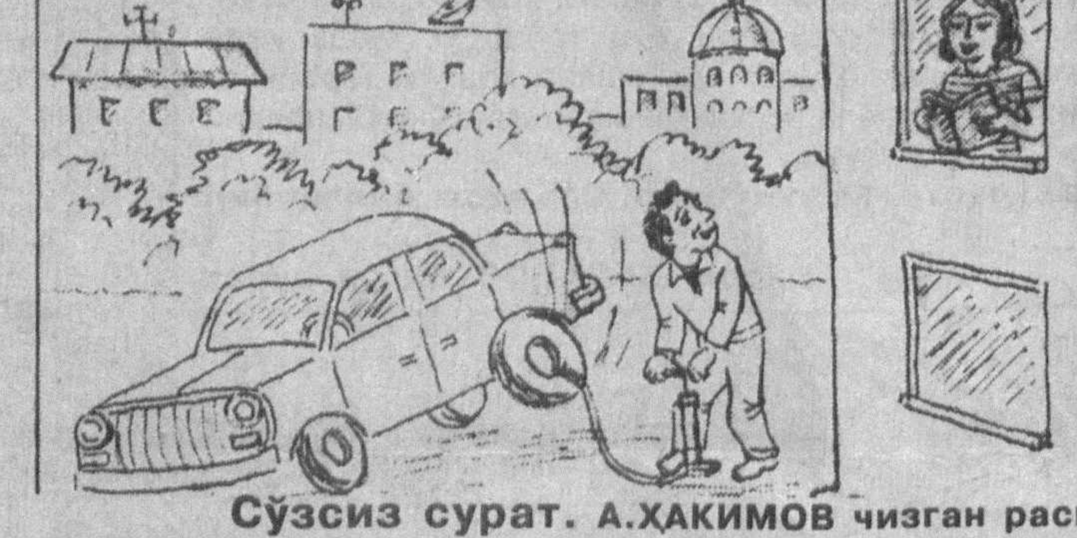
Сўзсиз сурат. А.ҲАҚИМОВ чизган расм

Вақти-вақти билан синфдош дўстлар учрашиб туришарди. Бу сафар улар Салимининг меҳмони бўлишди. Дўстлар гурунги аламахалгача давом этди.