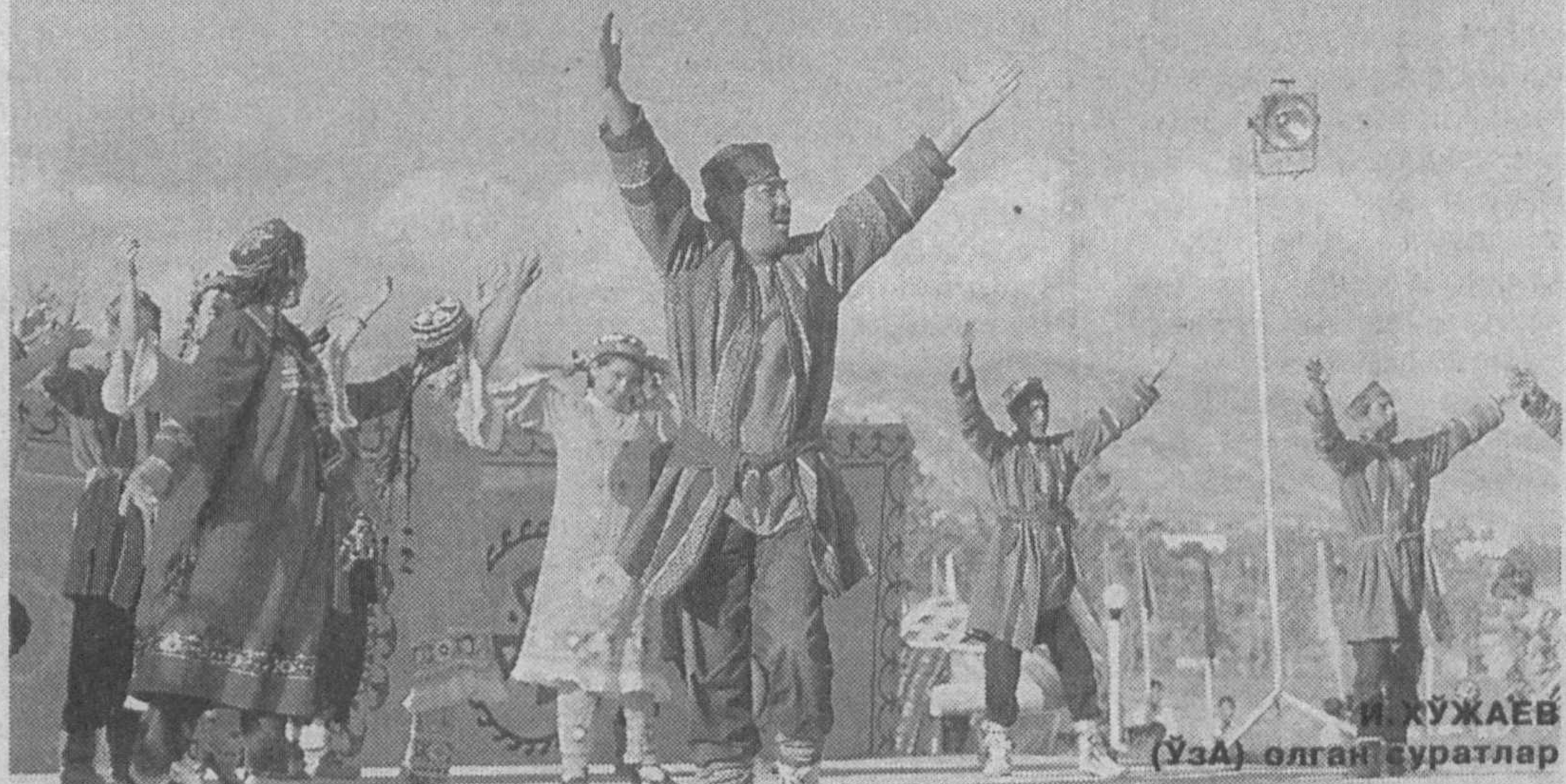
Мандчилиги кўрғазмалари қолдирмоқда. «Бойсун баҳори» фестивали қатнашчиларининг чиқишлари.

Бойсун тоғ бағрида «Бойсун баҳори» учинчи халқаро очик аънавий фольклор фестивали ўтказилмоқда. Унда республикамизнинг барча вилоятларидан фольклор этнографик дасталар иштирок этмоқда.