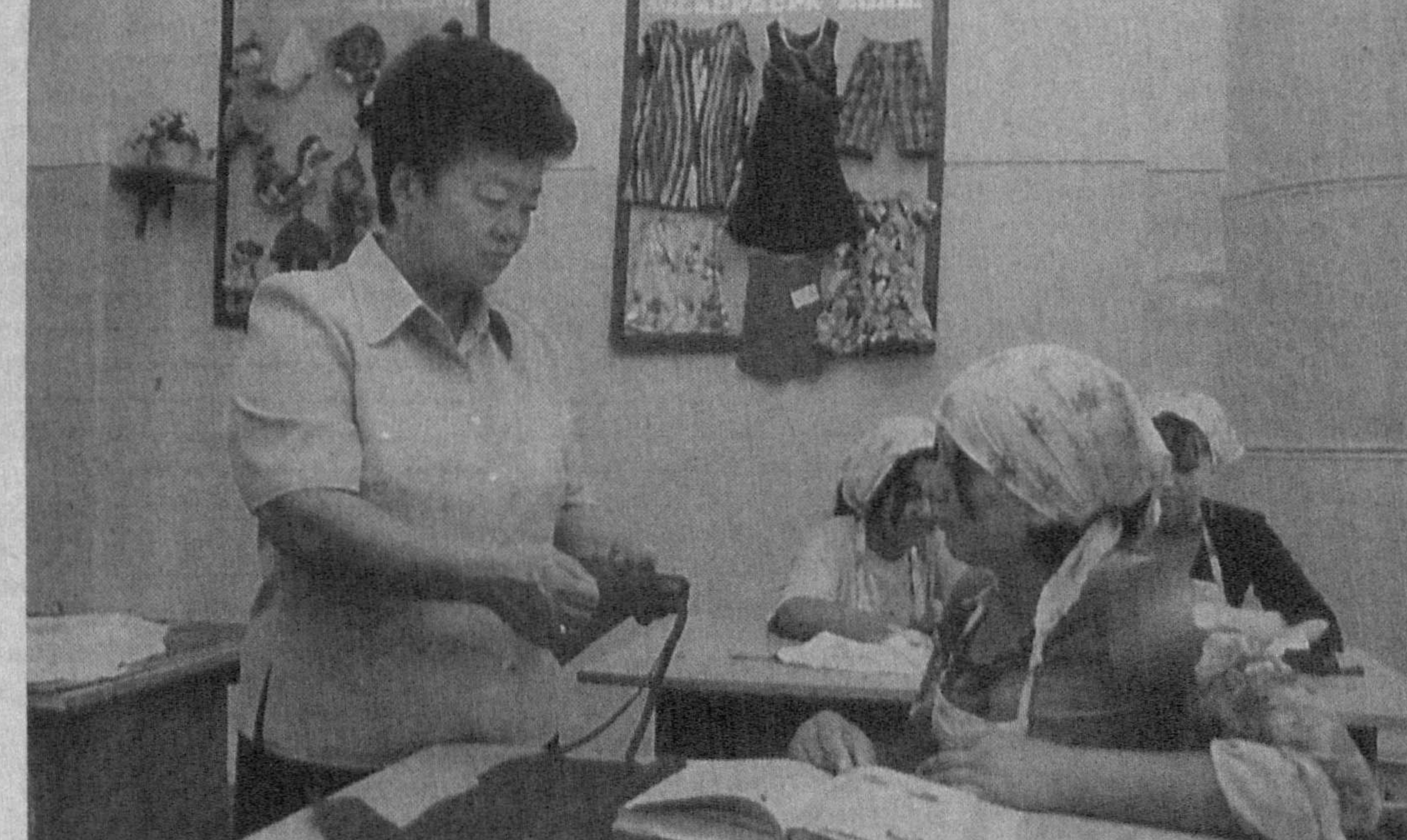
Охангарон шаҳридаги 7-ёрдамчи мактабда 187 нафар ўқувчи 9-синфга таълим тарбия олади. Мактабда назарий билимлар билан бир қаторда касб-ҳунар ўргатишга ҳам алоҳида эътибор қаратилган. Болалар чилангар, тикувчи мутахассислиги бўйича илк сабоқни ушбу илм масканида оладилар. Шаҳар ҳоқимлиги, прокуратура мактаб жамоасини моддий жиҳатдан қўллаб-қувватламоқда. Яқинда кам таъминланган ўқувчилар учун улар томонидан 1 миллион 384 минг сўмлик кийим-кечак уюштирилди.

Ўзбекистон Республикаси Президенти И.КАРИМОВ