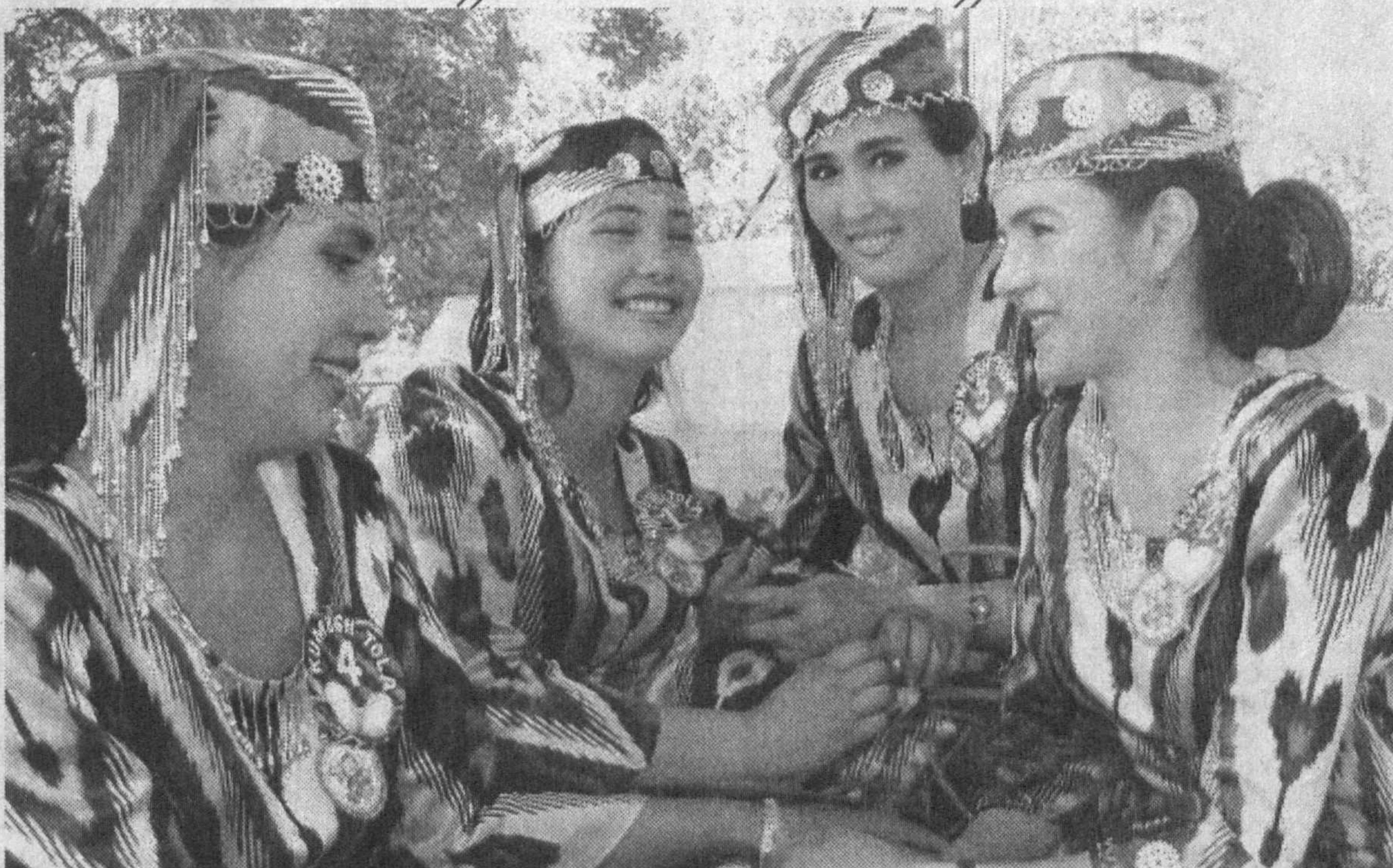
Юрти. Кураш. 22.20 Футбол. Осиё чемпионати лигаси "Нефчи" - "Ал Араби".

7.30 "Хабарлар" (ўзбек тилида). 7.45 "Бардам бўлинг".