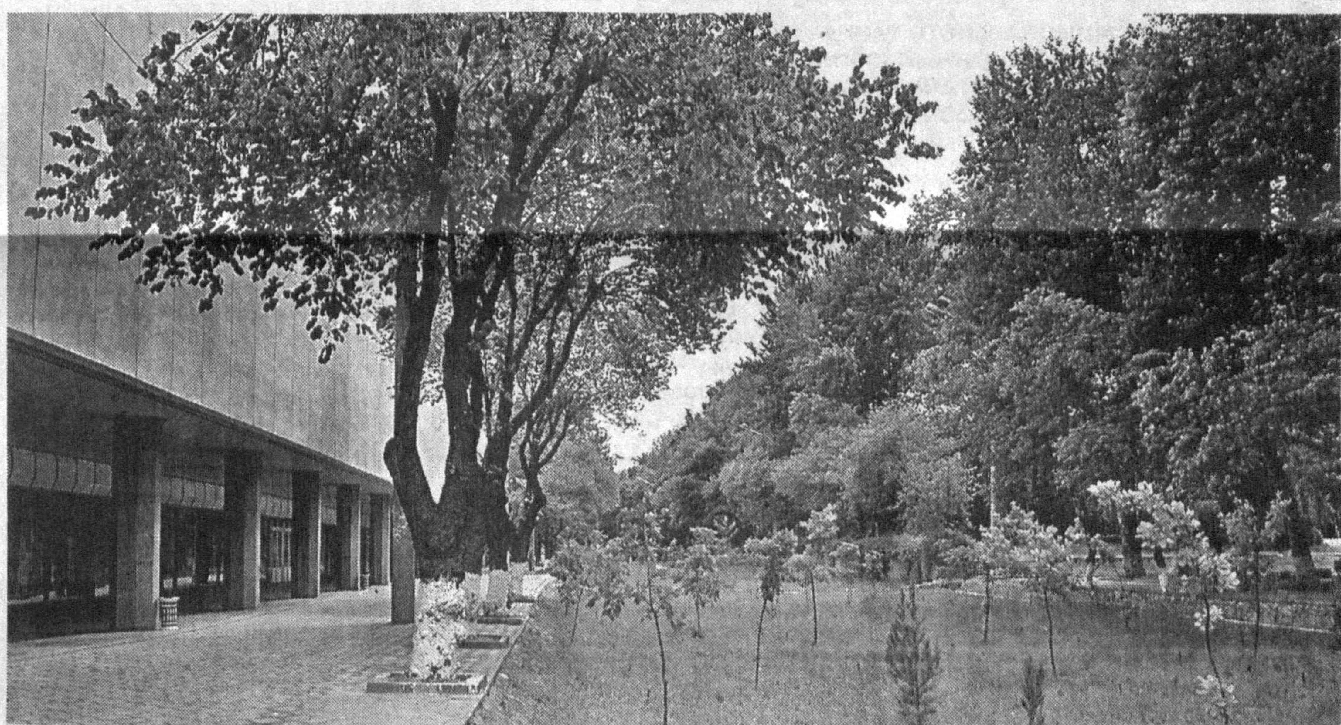
Столица оделась в зеленый наряд.