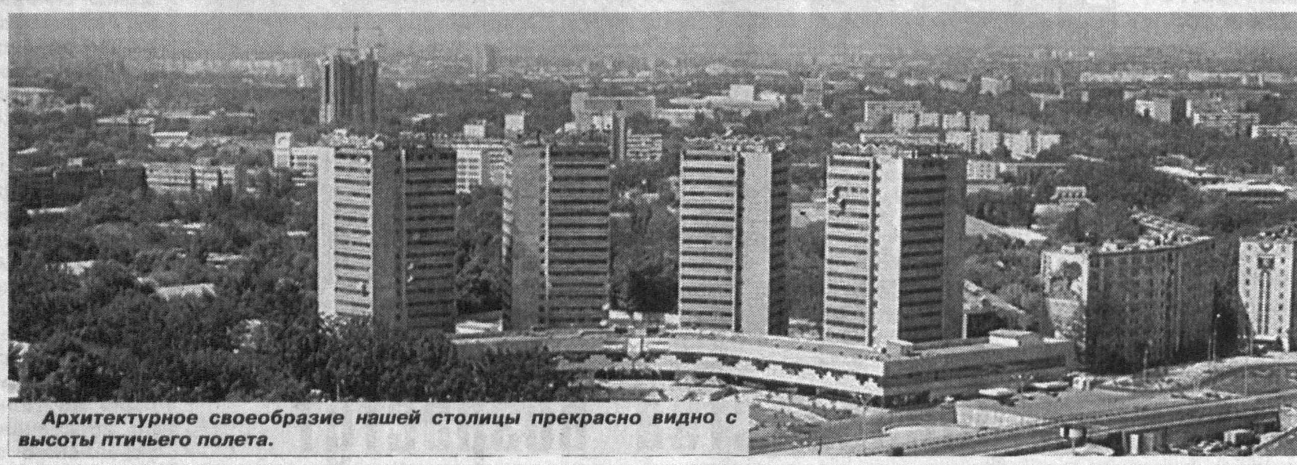
Архитектурное своеобразие нашей столицы прекрасно видно с высоты птичьего полета.