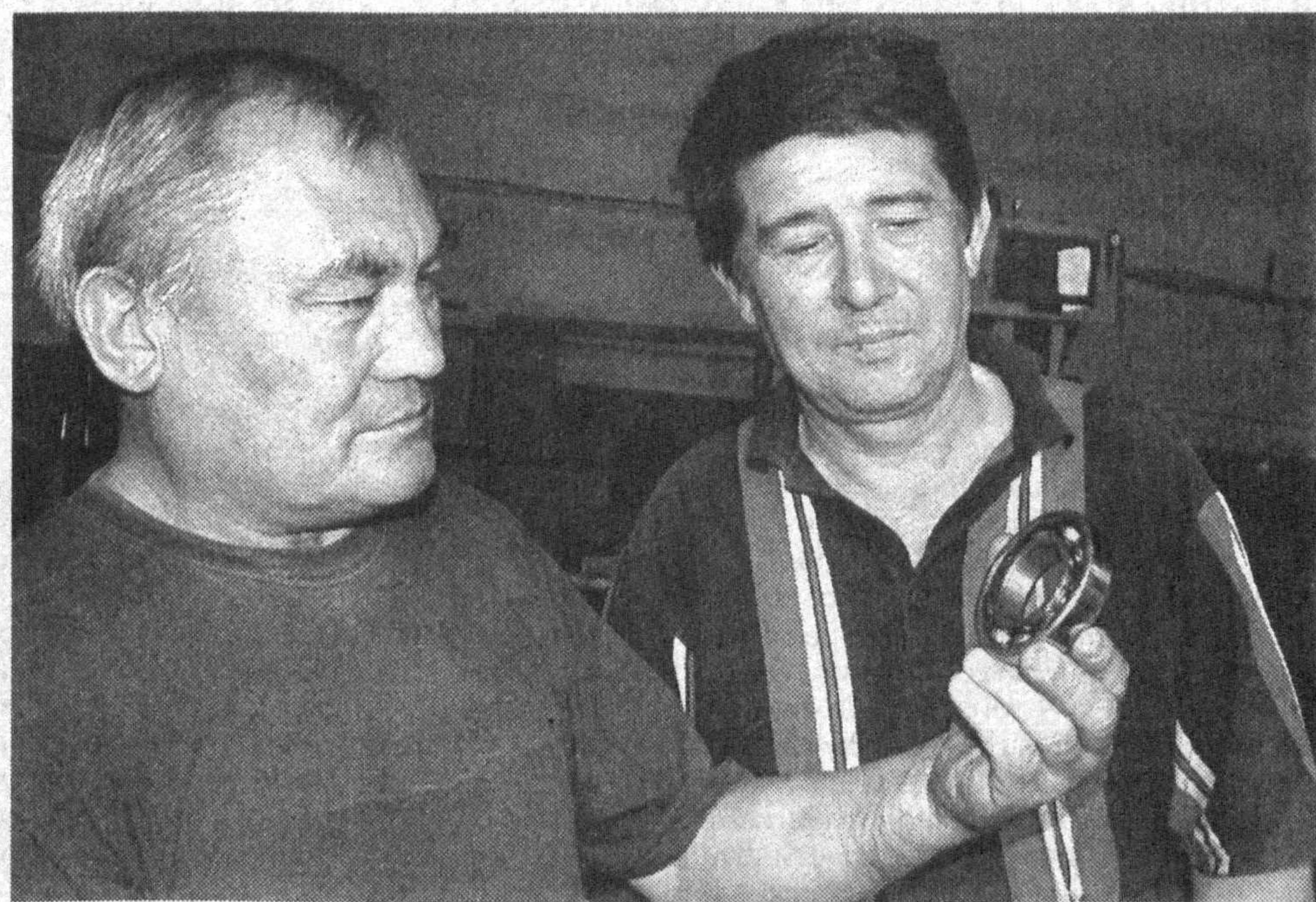
2009 год — Год развития и благоустройства села

● В результате двух подземных толчков, произошедших на территории восточных провинций Афганистана, погибли, как сообщается, от 20 до 40 человек. Несколько десятков получили ранения, разрушено до 200 жилых домов в четырех деревнях. Сила первого толчка составила 5,5 балла, второго — 5,1 балла.