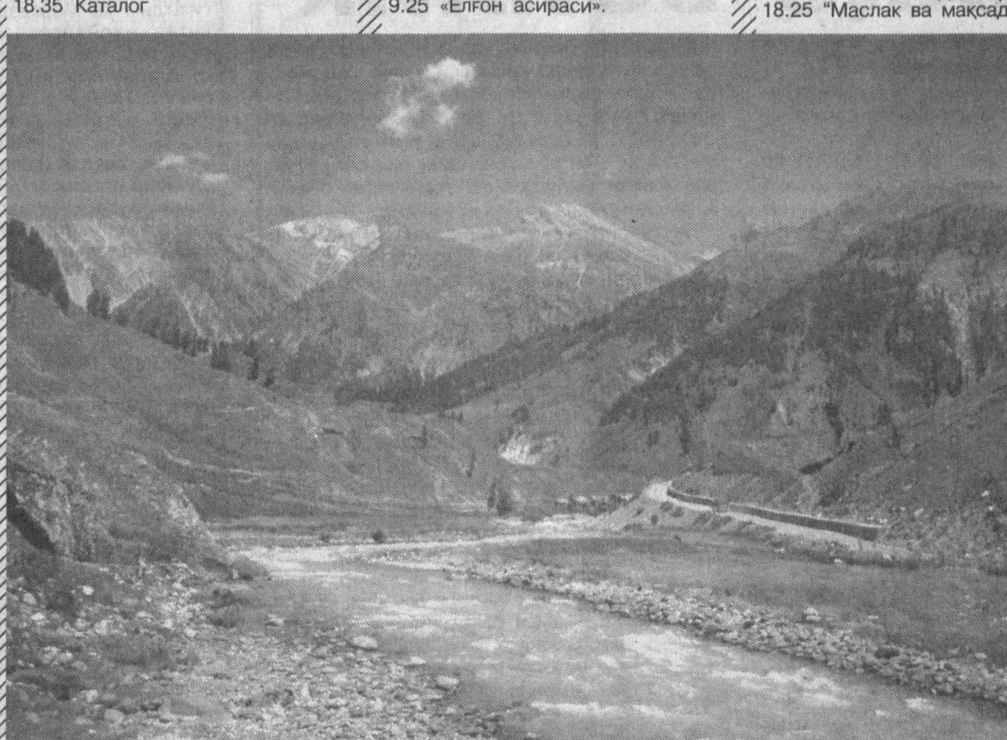
«Эги таътил кунларида»