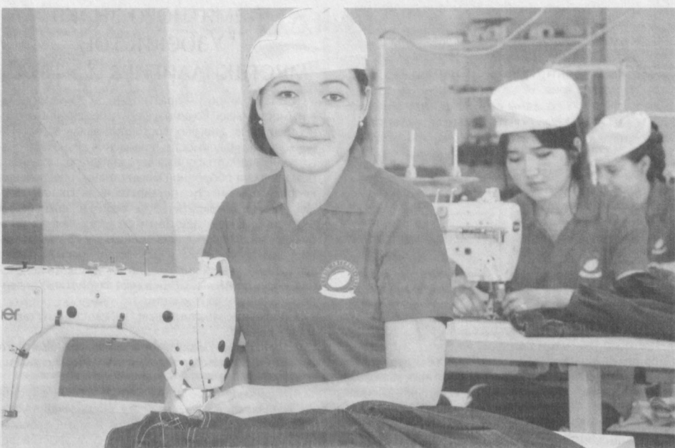
В Андижане на иностранном предприятии в форме общества с ограниченной ответственностью "Lemon International" выпускают 500 тысяч брюк в год.

Результативно внимание, уделяемое под руководством Президента широкому привлечению иностранных инвесторов, модернизации промышленных предприятий, внедрению в производство новых технологий.