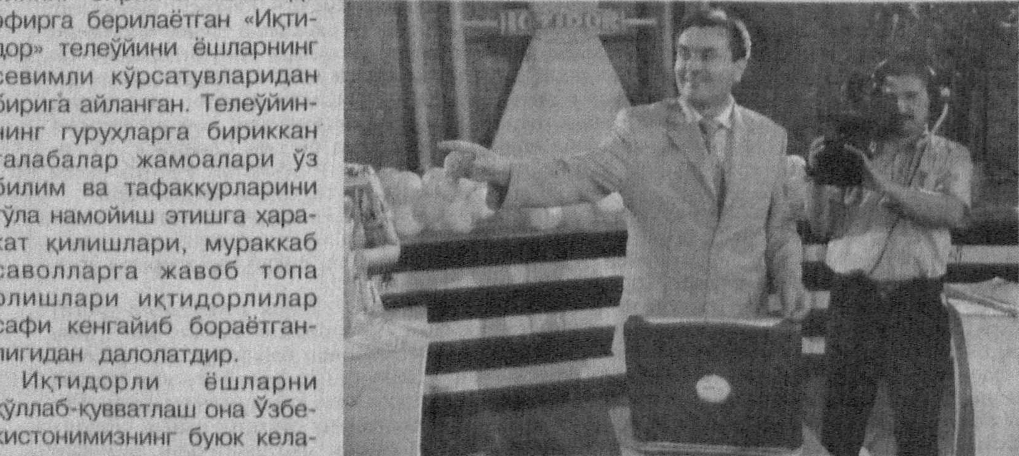
Иқтидорли ёшларни қўллаб-қувватлаш она Ўзбекистонимизнинг буюк кел-