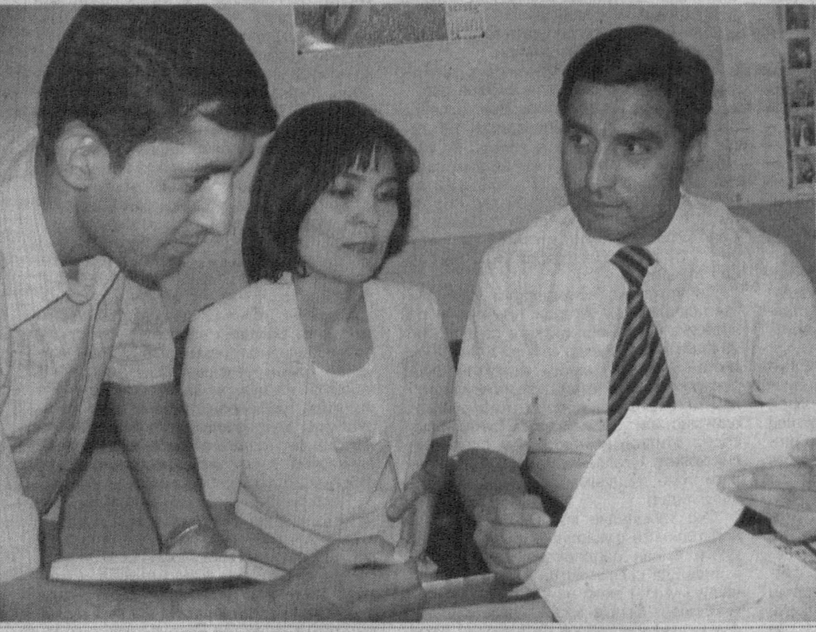
Ўзбекистон телевидениесининг биринчи каналда эфирга берилаятган «Иқтидор» телеуйини ёшларнинг сеvimли кўрсатувларидан бирига айланган. Телеуйиннинг гуруҳларга бириккан талабалар жамоалари ўз билим ва тафаккурларини тўла намойиш этишга ҳаракат қилишлари, мураккаб саволларга жавоб топа олишлари иқтидорлилар сафи кенгайиб бораётганлигидан далолатдир.