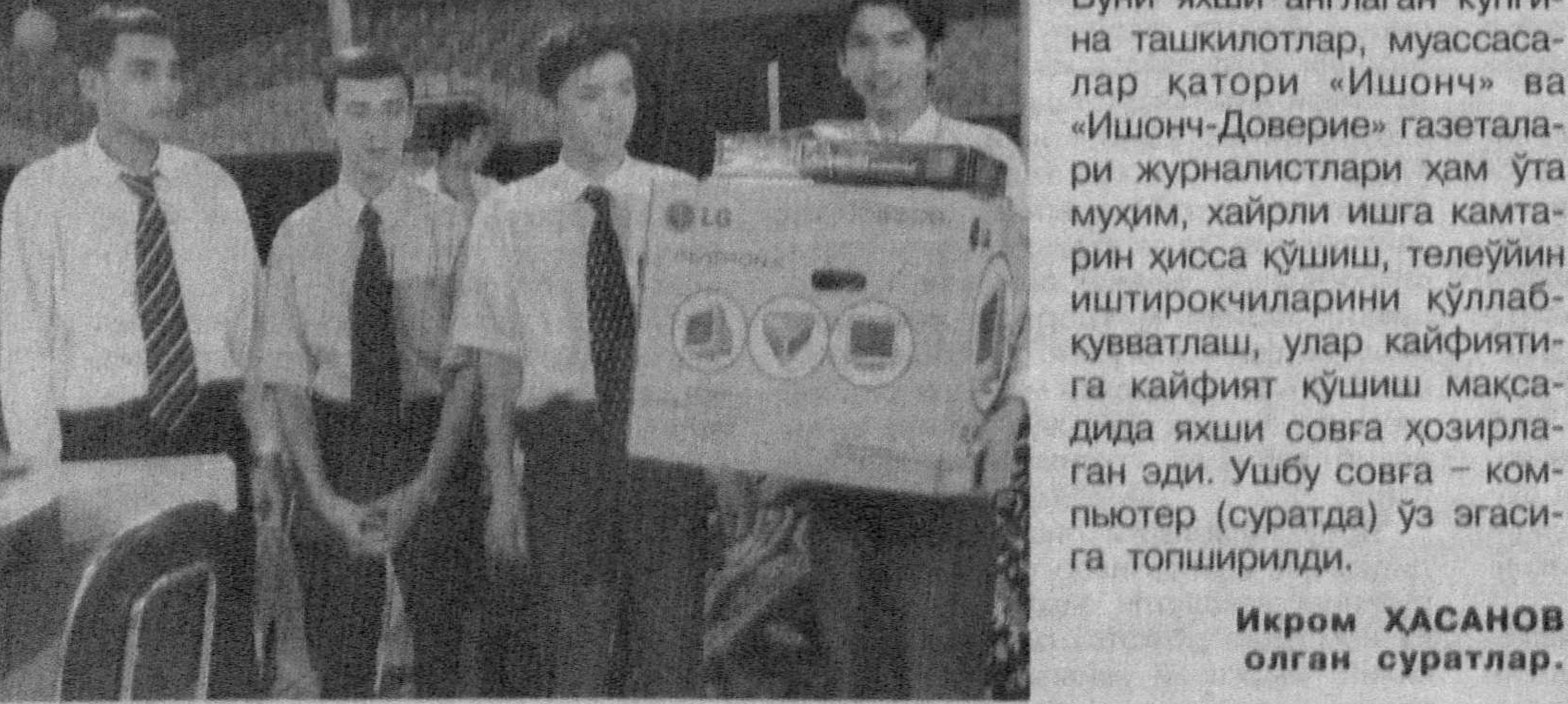
жагига хизмат қилишдир. Буни яқин англаган кўпгина ташкилотлар, муассасалар қатори «Ишонч» ва «Ишонч-Доверие» газеталари журналистлари ҳам ўта муҳим, хайрли ишга камтарин ҳисса қўлиши, телеуйин иштирокчиларини қўллаб-қувватлаш, улар қайфиятга қайфият қўшиш мақсадида яқин совға хозирлаган эди. Ушбу совға - компьютер (суратда) ўз эгасига топширилди.