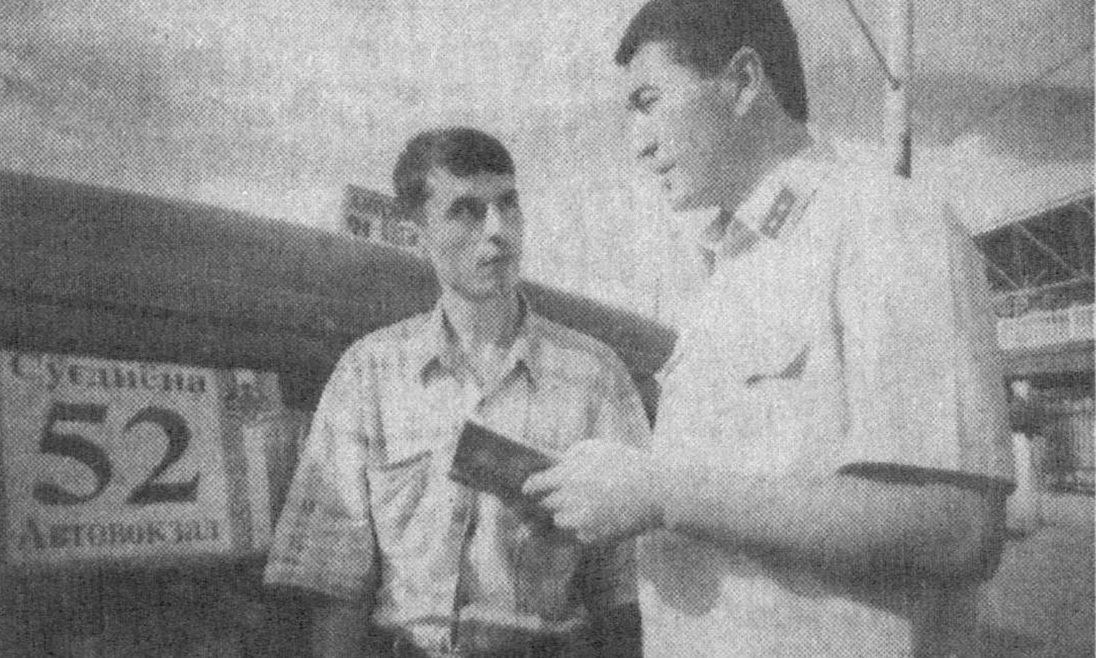
Биринчилардан бўлиб ушбу хукукка эга бўлган автоулов эгалари солиқ идорасидан берилган махсус йўналиш ёрликлари билан таъминланди.

Йўловчиларга намунали хизмат кўрсатишни ташкил этиш, автотранспорт воситаларининг ҳаракатланиш хавфсизлигини таъминлаш ҳамда солиқларнинг ўз вақтида давлат хазинасига тушишини назорат қилишда соҳа ходимларининг хизматлари катта бўлаёттир. Хусусан, Самарқанд шаҳар давлат солиқ инспекцияси томонидан 1612 та йўловчи ташвиш енгил автотранспорт воситалари рўйхатида олинган. Республикада