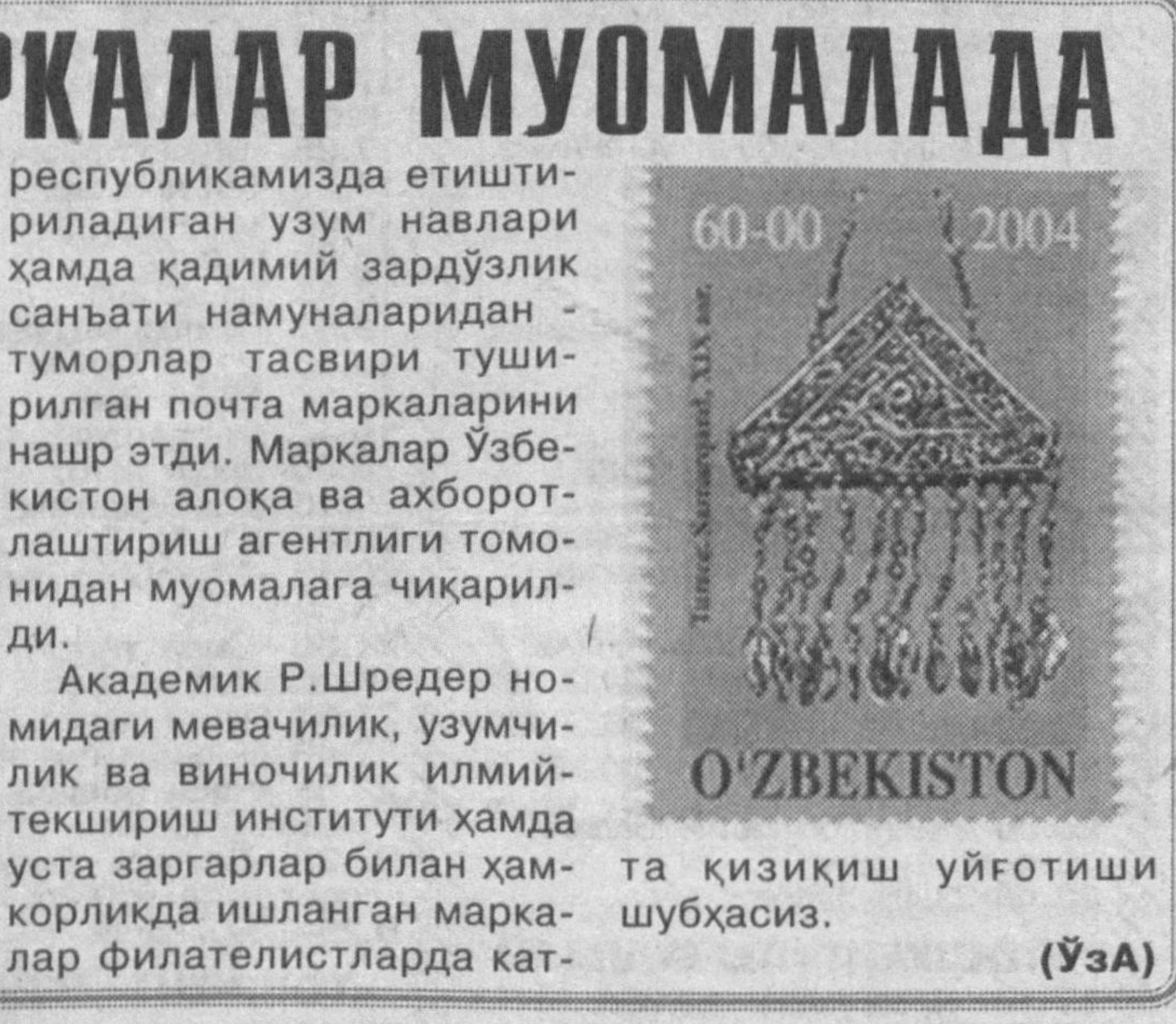
та қизиқиш уйғотиши шубҳасиз. (ЎЗА)