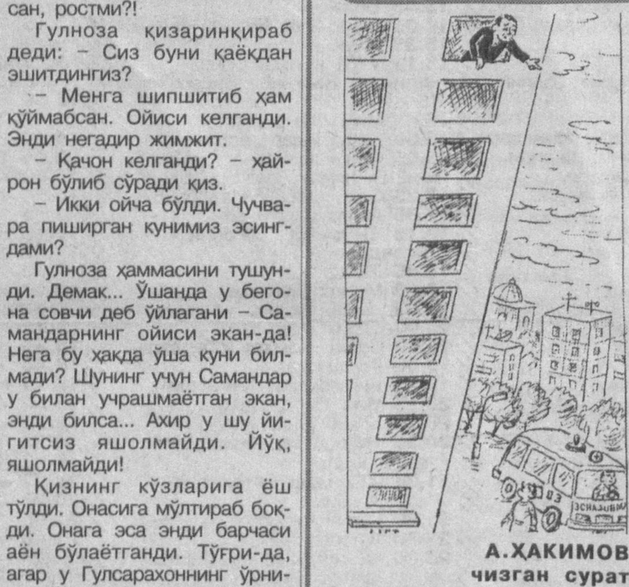
А.ХАКИМОВ чизган сурат

Келаси йилнинг январ ойида Туркиянинг Анталия шаҳрида футбол бўйича «Turk-Kap» халқаро турнири бўлиб ўтади. Унда Туркия чемпионатининг икки пешкадан жамоаси, шунингдек Қозғистон, Қирғизистон, Тожикистон, Туркменистон, Озарбайжон ҳамда Ўзбекистон чемпионлари қатнашиши мўлжалланган. Мусобаканинг жамоалар учун қулай жиҳати шундаки, барча харажатлар, ҳаттоки турнирга бориб-қелиш сарфларини ҳам ташкилотчилар ўзимизга олишган. Лекин бу йилги чемпионатда голиб чиқиши кутилаётган «Пахтакор» турнирга бормаслиги мумкин. Негаки, жамоа МДХ чемпионлари кубоғи баҳсларига пухта тайёргарлик қўриш мақсадида Бирлашган Араб Амирликларига сафар этмоқчи. Тошкентликларнинг ўрнига «Нефтчи» жамоаси қатнашиши кутилмоқда.