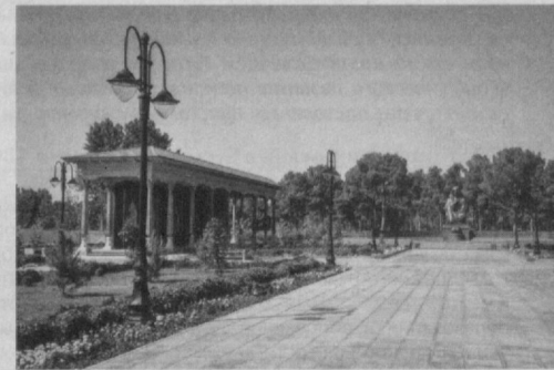
Сад "Саду счастья" в Термезском районе.

Здесь произведены строительномонтажные работы на 17,5 млрд сумов, - говорит главный инженер частной строительной фирмы "Файз-Бинокор-Олтирик" Мухторали Пармонов. - Учитывая ценные рекомендации и искренние слова поддержки нашего тру-