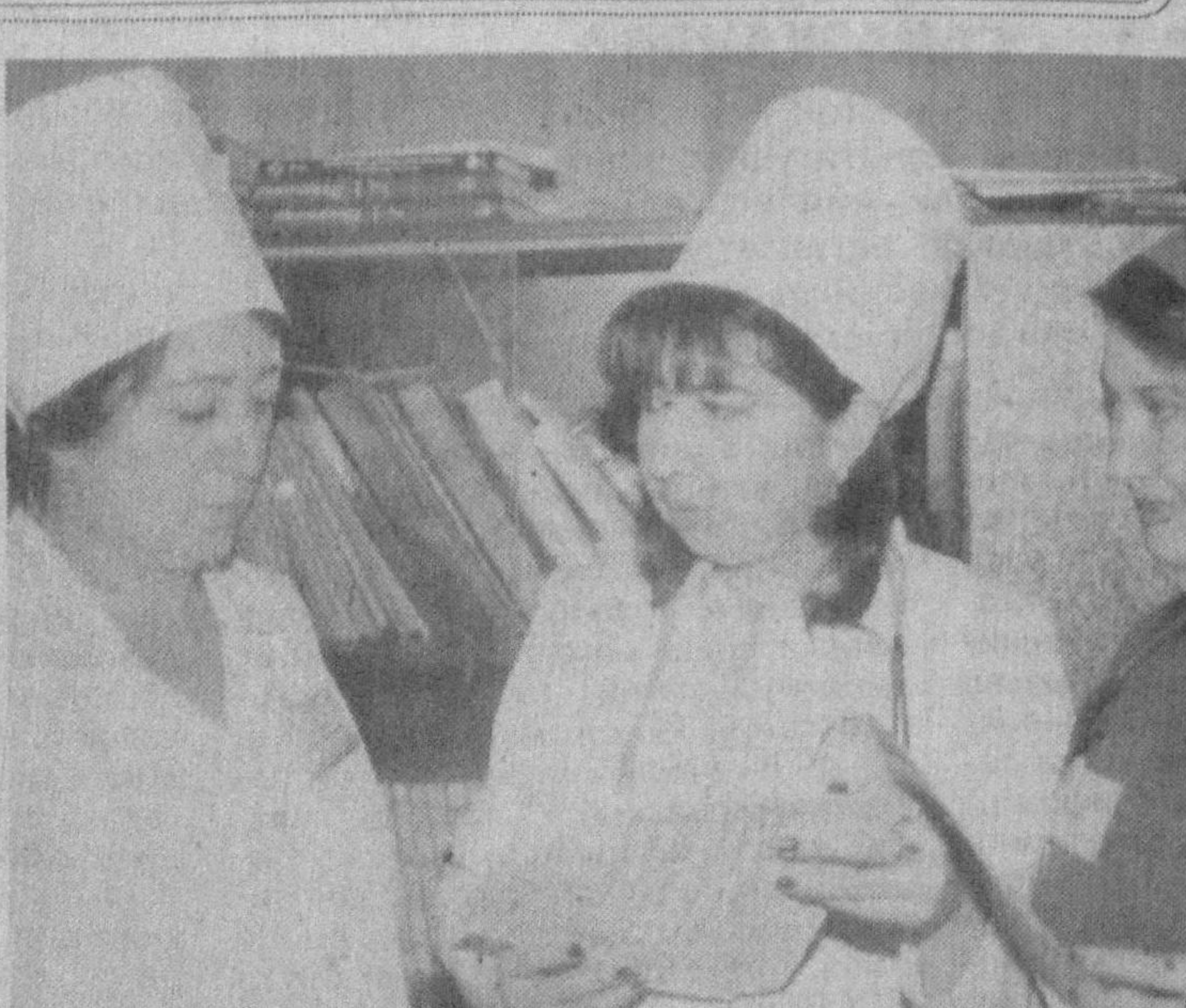
Утган 9 ойда алоқа тизими корхоналарида ишловчи кам таъминланган, кўп фарзандли оилалар, пенсионер ва ногиронларга 5,6 миллион сўмдан ошиқ моддий ёрдам кўрсатилди.

Инсон қорни учун эмас, қадрни ўнганда, дейишади. Буни ўз бошимдан ўтказдим. Фарзандим 2 ёшга тўлган қадрдон жамоам оstonасидан ҳатладим. Муддао семимли ишимга қайтиш, ҳамкасбларим даврасида бўлиш эди. Аммо соғиниб, энтикиб келган ишхонам эшикларини ёпиштирдим. Энди сизни ишга ололмаймиз, деганлариде хайратдан қараёт бўлиб қолдим. Нега, гуноҳим нимада? Таассуфки, бу саволларим ҳавода муаллақ қолди.