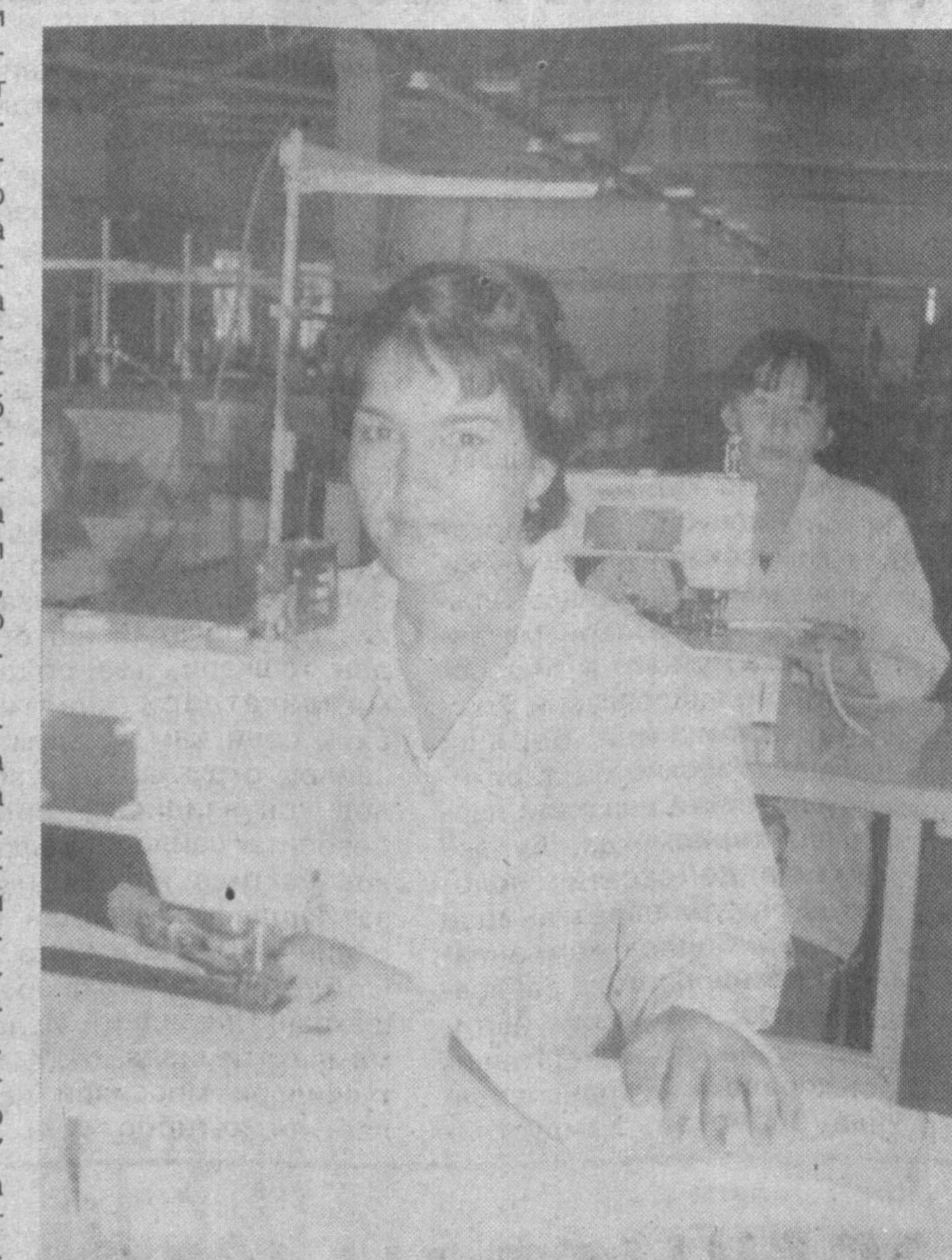
Кўшимча таътилларда соҳа ходимлари икки ойлик маош миқдорига рағбатлантирилмоқда. Инсон омилга эътибор қаратиб, уларга имконият яратиб бераётган бундай корхоналар талайгина. Бу жамоаларда

Жамоадаги мўътадил муҳит, меҳнатқашларнинг ижтимоий-иқтисодий ҳамда ҳуқуқий ҳимояси, кишилар саломатлиги муҳофазаси, ҳуллас, барча муносабатлар жамоат ташкилоти фаол иштироки тақозо этади. Масъулиятли бурч эса ҳар доим бизни сергакликка ундаб келади. Тармоғимиздаги 26 та касабаяошма ташкилоти етакчилари жамоатчилик асосида фаолият юритиб келмоқда. Улар келишувлар, меҳнат шартномалари ва битимларда кўзда тутилган имтиёзларни амалиётга жорий этиш, кўшимча афзалликлар яратиш пайида бўлишаптир.