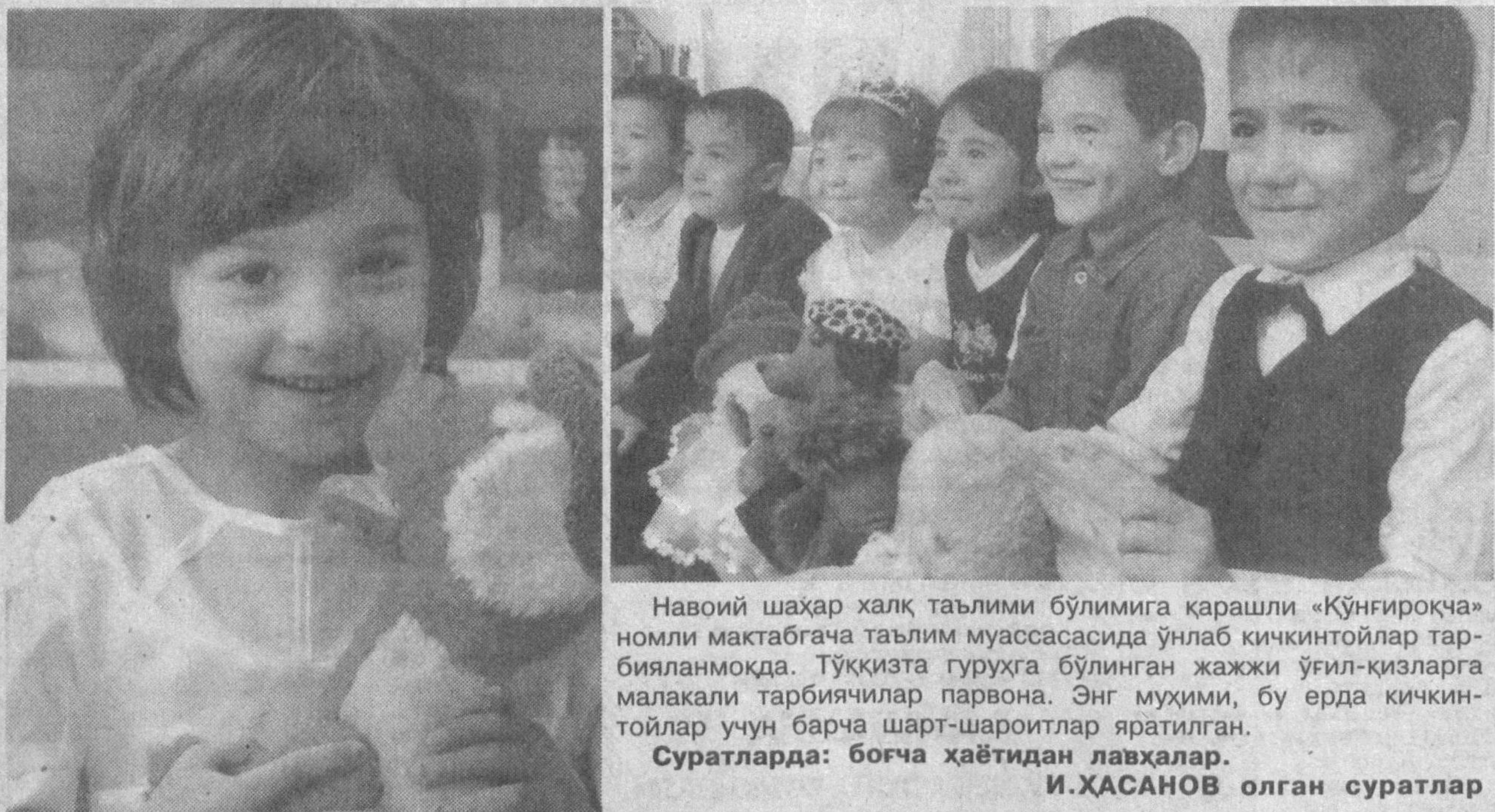
Навоий шаҳар халқ таълими бўлимига қарашли «Кўнғирокча» номли мактабгача таълим муассасасида ўнлаб кичкинтойлар тарбияланмоқда. Тўққизта гуруҳга бўлинган ҳажжи ўғил-қизларга малакали тарбиячилар парвона. Энг муҳими, бу ерда кичкин- тойлар учун барча шарт-шароитлар яратилган. Суратларда: боғча ҳаётидан лавҳалар.

Денгиз оқимлари асосан, иккига-илик ва совуқ оқимлар- га бўлинади. Бунда оқимнинг ҳарорати шу оқимнинг атро- фидоги сув ҳароратидан юқори ёки паст бўлишига боғлиқ бўлади. Агар оқим атрофидаги сув совуқроқ бўлса, бундай оқим илик, оқим атрофидаги сув илқроқ бўлса совуқ оқим ҳисобланади.