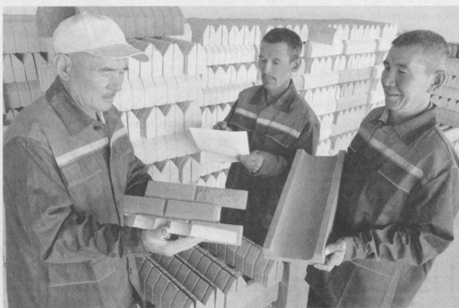
В обществе с ограниченной ответственностью "Shariyar Saniyar Nukus" города Нукуса Республики Каракалпакстан налажен выпуск брусчатки и офисной мебели.

Малое предприятие изготавливает 70-80 квадратных метров брусчатки в день и офисную мебель