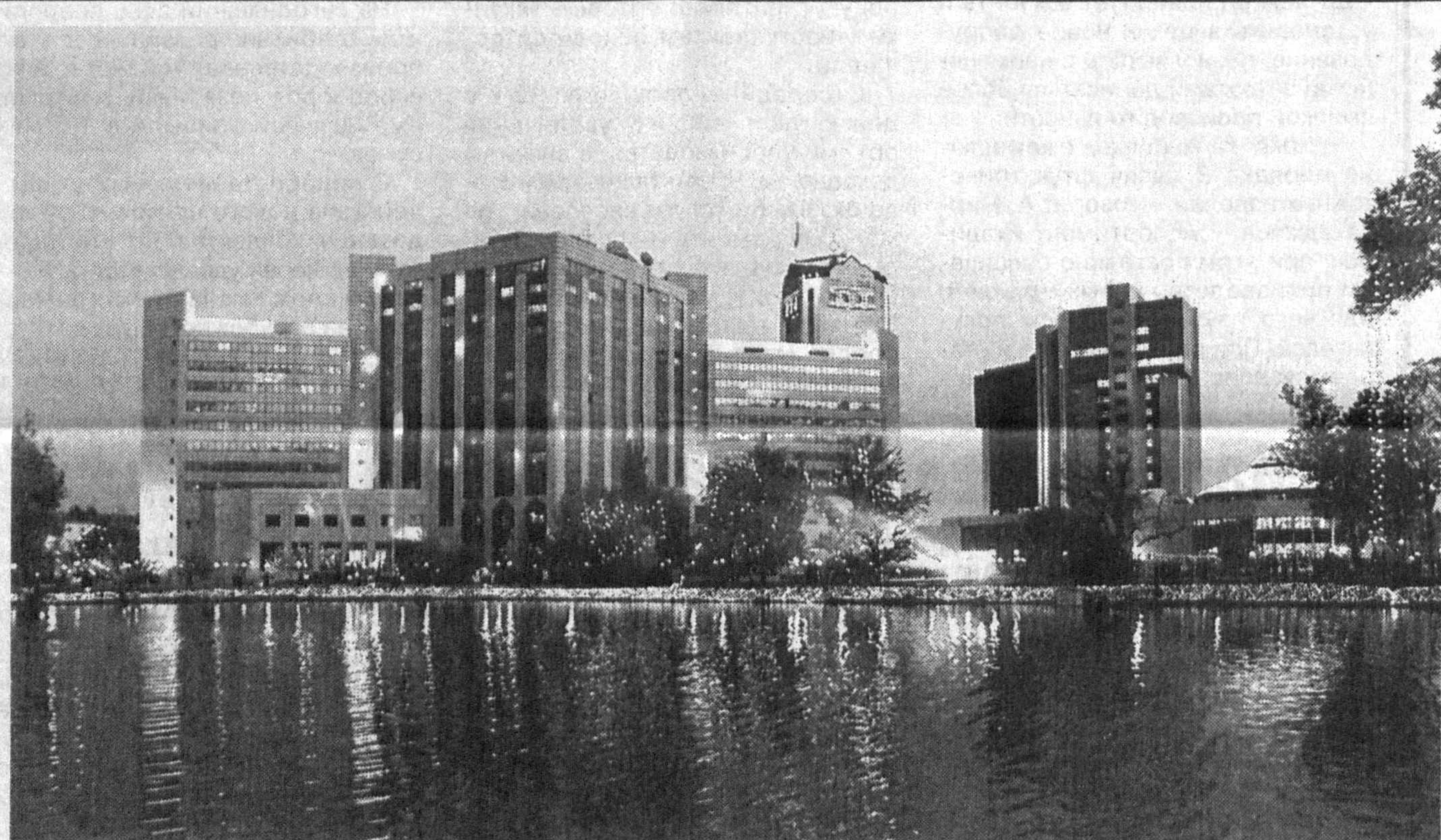
Поражает Ташкент красотой своих зданий.